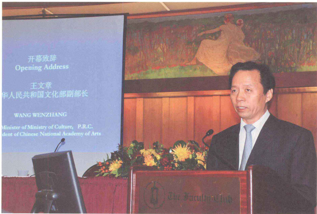
中华人民共和国文化部副部长、中国艺术研究院院长王文章开幕式致辞

Address at the Opening Ceremony by Wang Wenzhang, Vice Minister of Ministry of Culture of P.R.C, President of Chinese National Academy of Arts