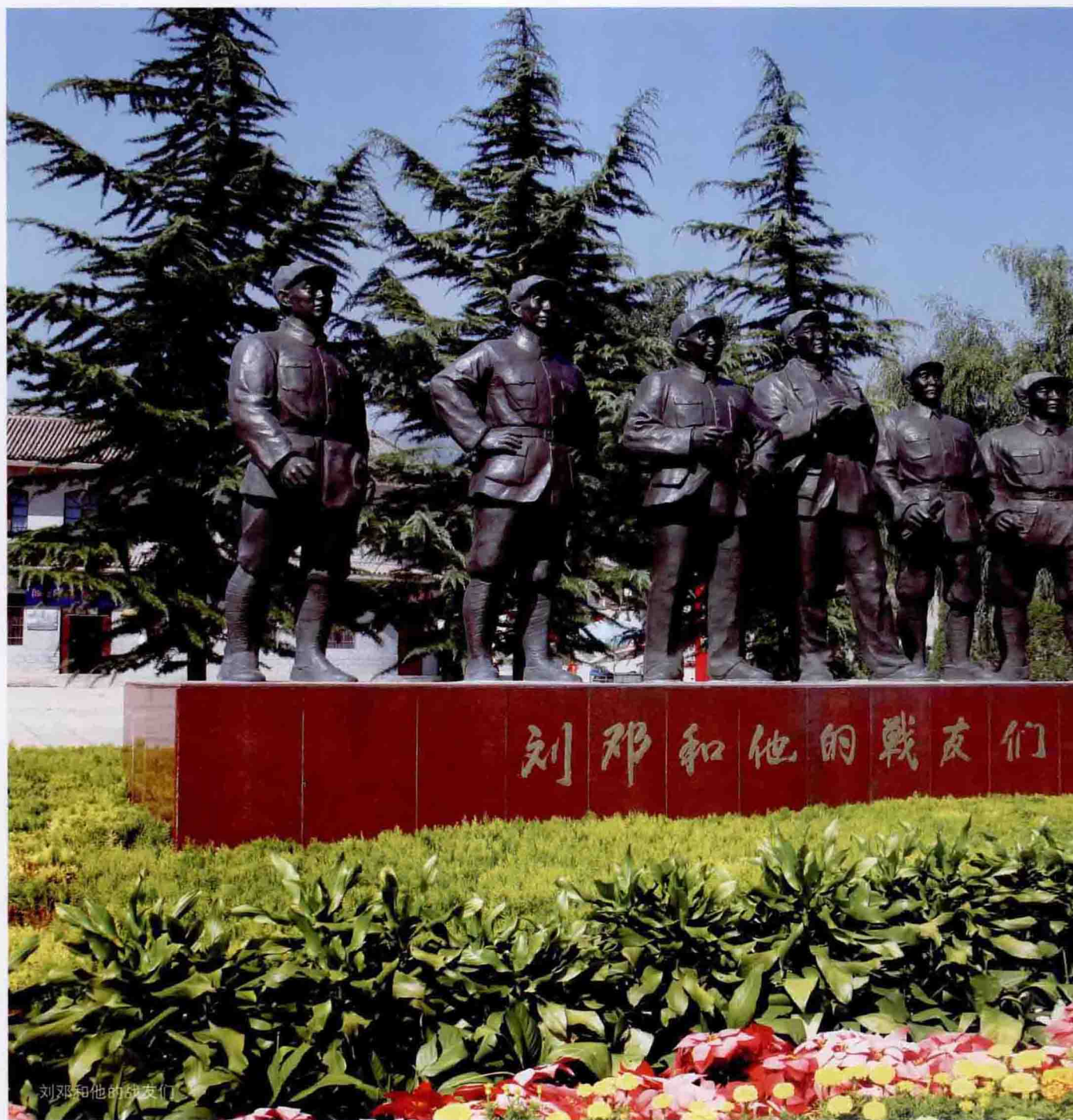
刘邓和他的战友们