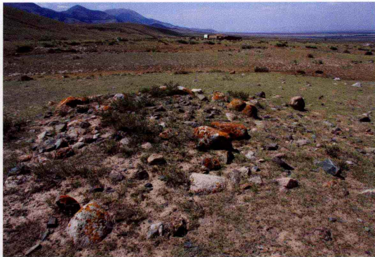
红山口墓群墓葬封堆

位于巴里坤县奎苏镇奎苏村西南、天山北麓红山口前缓坡地带，分布面积约1800万平方米，发现各类墓葬240余座，主要分布于墓葬区的中上部的小山坡周围，以及小红山东部。多为圆形土石混合封堆墓，封堆中心凹陷，形成环形石堆，直径5~10米，多数在4~7米，直径10米以上的封堆主要分布于西边的小山包上。有的墓葬带一个或多个疑为祭祀设施的小石堆，有的地表有立石。另有少量墓葬无封堆，地表以石块围一周，形成圆形石圈或方形石围，有的石圈中填碎石块。在墓葬区周围还发现有很多的岩画和居址。墓群年代推测为战国到秦汉时期。