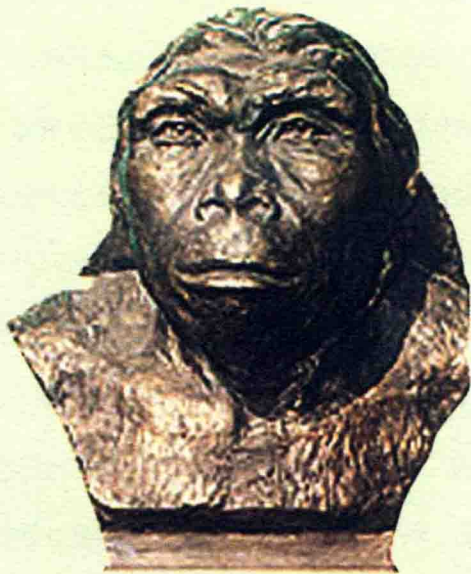
图3 蓝田人复原头像

100多万年前的陕西蓝田气候温暖湿润，红色的土壤像一块厚厚的地毯覆盖着整个大地，真可谓树木繁茂、绿草如茵。老虎、小鹿在草地上奔跑，熊猫、羚羊在树林中玩耍，犀牛、大象在湖边嬉戏，同时还有一些眉骨突出、鼻梁扁塌、身材矮小的蓝田人成群结队的在丛林中攀援。这是一幅多么和谐美好