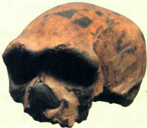
图4 大荔人头骨化石

目前发现的完整人类头骨化石中最古老的。据科学测定，这是一位30岁左右的男性头骨，他的脑容量增加到了1120毫升，仅差我们现代人300毫升。他们已经更多地脱离了动物的痕迹，而接近古现代人。