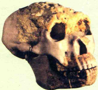
图2 蓝田人头骨化石

1964年春天，考古学家在陕西西安蓝田县公王岭发现了一具比较完整的猿人头盖骨化石（图2），据科学测定这是一位年纪约30岁左右的女性。“蓝田人”是陕西大地上最早的人类，也是迄今我们所知亚洲北部最早的直立人（图3）。