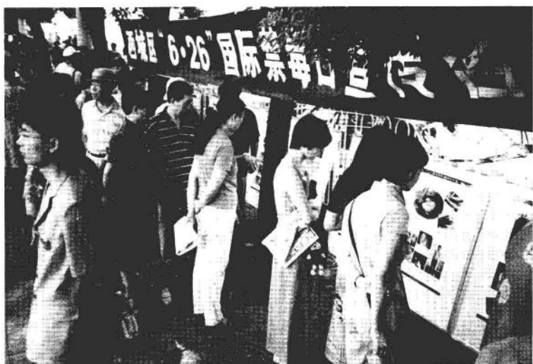
群众聚精会神地观看禁毒宣教展板。