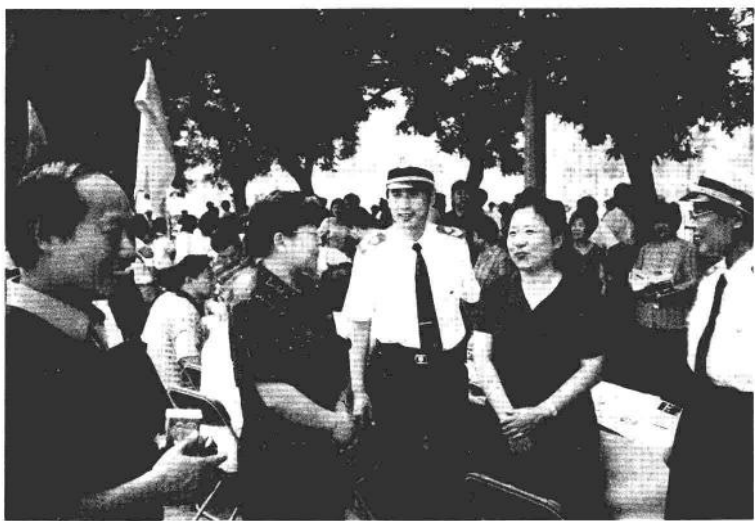
北京市西城区区长吕锡文与副区长、区禁毒委主任曹长胜同志在药监局宣传咨询台前。