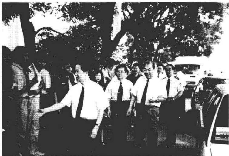
公安部部长贾春旺，副部长白景富，中共北京市委副书记、政法委书记强卫等领导同志到北京市西城区参加“6·26”国际禁毒日宣传咨询活动。