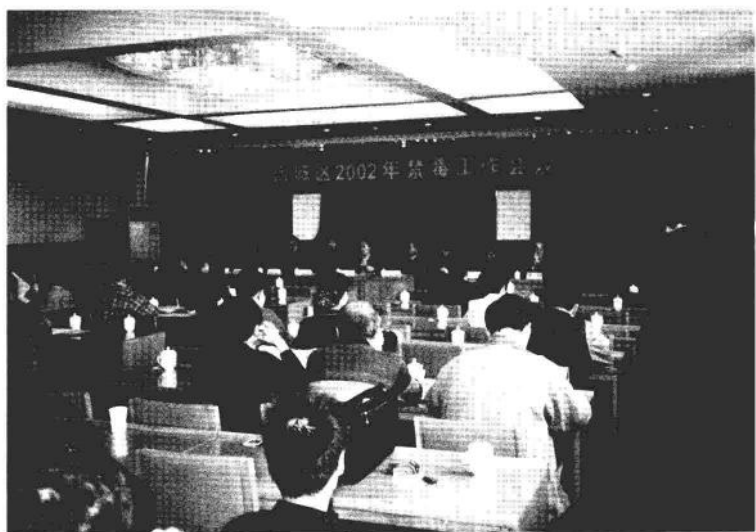
召开禁毒工作会议。