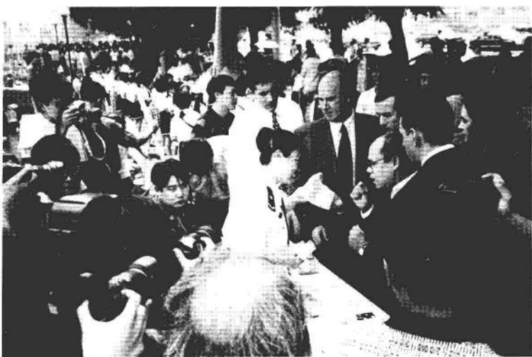
联合国禁毒官员在禁毒咨询台前。