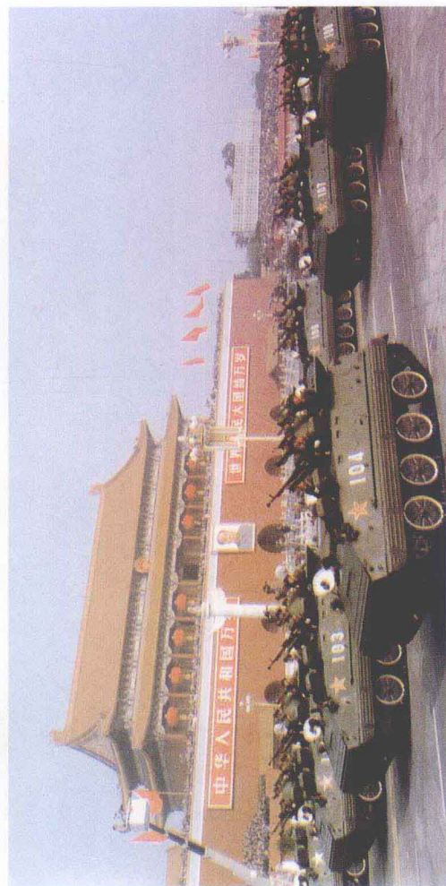
—— [1] 在国庆 35 周年阅兵大典上接受检阅的 69—III 式坦克