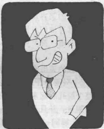
内性型不明确的假笑

笑的方式有好多种，外向型的爽朗笑容是属于单纯而明快的种类，至于内向型的笑容则相当的复杂，而且以不明确者居多。