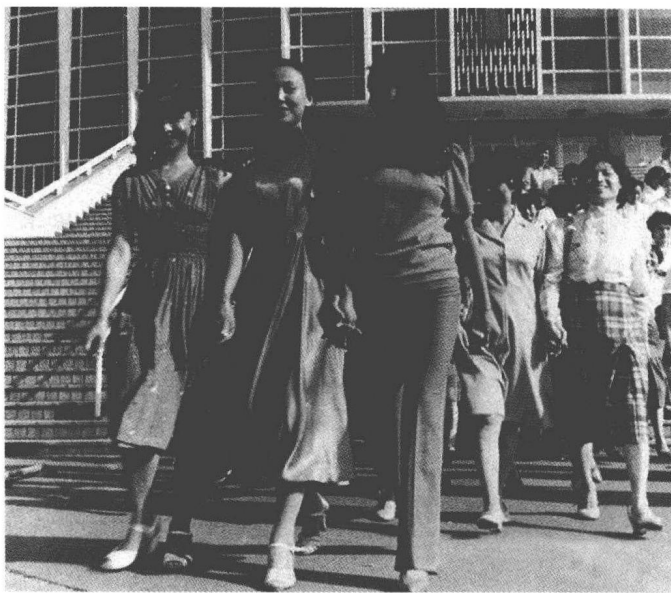
《街上流行红裙子》剧照

1984年，一部由长春电影制片厂拍摄的电影《街上流行红裙子》上映，女主人公那一袭红色衣裙强烈冲击着习惯于绿、蓝、黑、白、灰的人们的