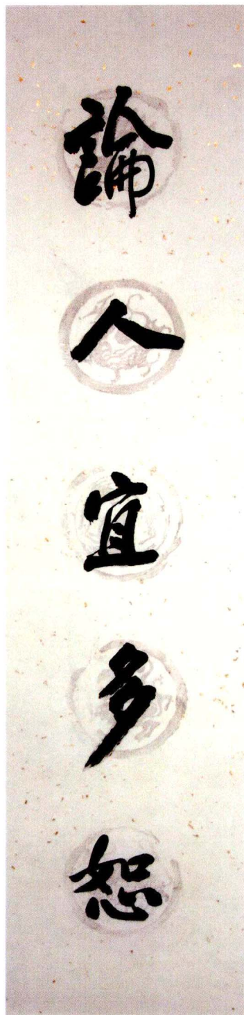
论人宜多怒（自撰诗句） 甲申（2004）年