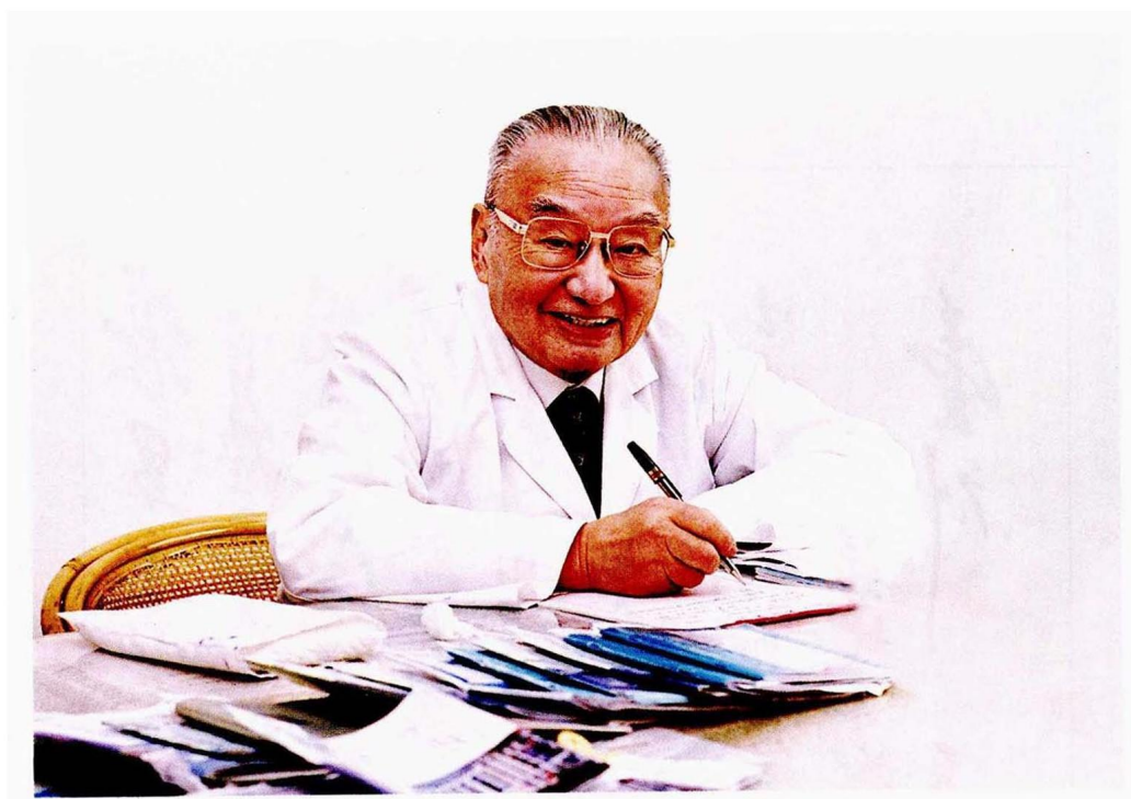
耄耋之年坚持门诊