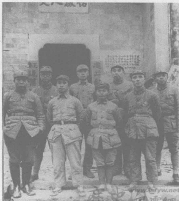
1939年春，周恩来在皖南新四军军部视察期间同新四军领导人合影。 左二起为袁国平、粟裕、陈毅、王集成、周恩来、邓子恢、项英。