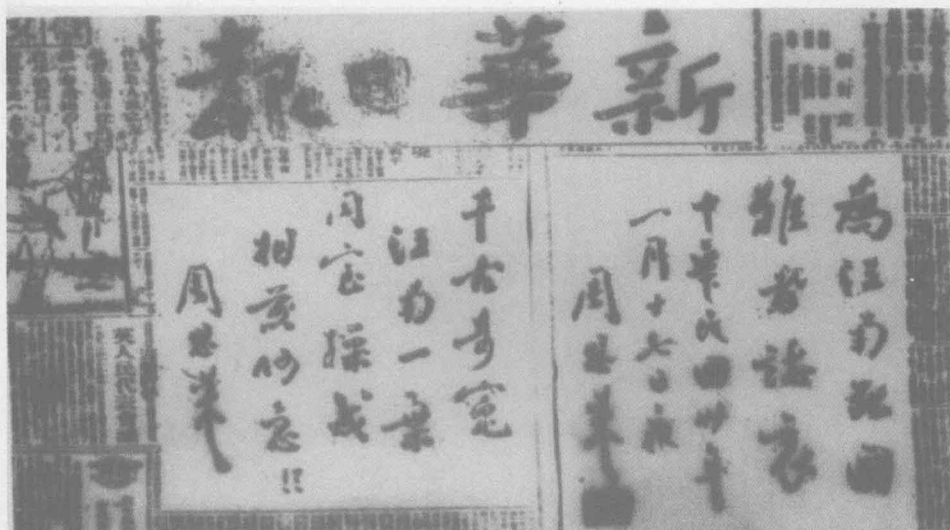
周恩来为抗议国民党顽固派制造皖南事变 在1941年1月18日重庆《新华日报》上题词并写挽诗。