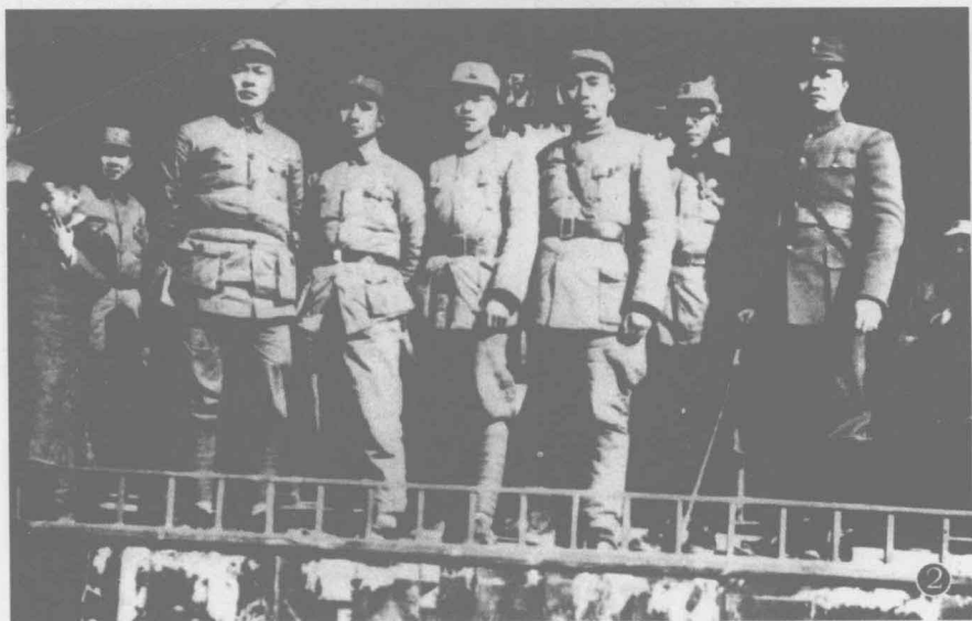
1939年春周恩来视察皖南新四军军部时与新四军负责人合影，左起陈毅、粟裕、傅秋涛、周恩来、朱克靖、叶挺。