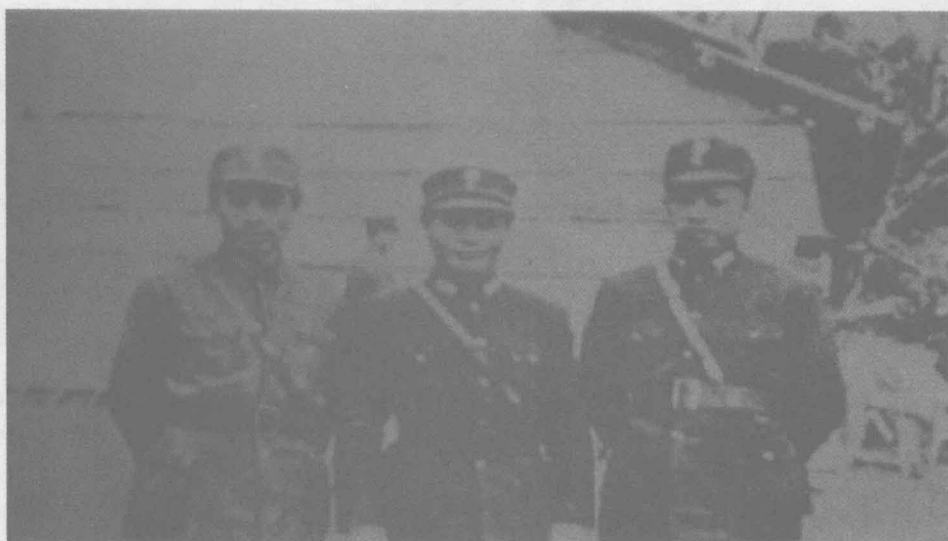
1939年周恩来（左）、陈诚（中）、叶挺在重庆。