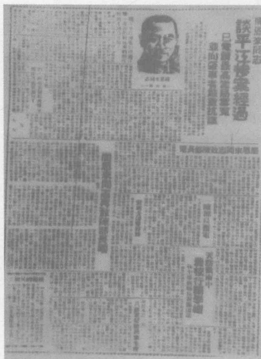
1939年夏，国民党顽固派蓄意制造平江惨案后，周恩来发表谈话揭露事实真相并提出严重抗议。这是发表周恩来谈话的解放区《新中华报》。