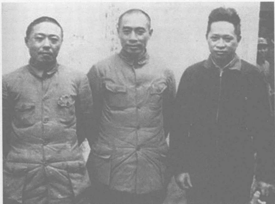
周恩来（中）1939年春在皖南与新四军军长叶挺（右）、副军长项英合影。