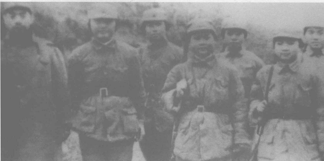
周恩来在皖南新四军军部视察期间与女战士合影。