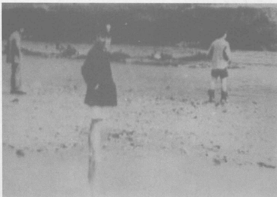
抗战胜利后，蓄意发动内战的蒋介石集团重兵围困新四军第五师及其开辟的华中抗日根据地。1946年夏，周恩来前往视察，因途中突遇大雨，交通中断，图为周恩来涉水前往新四军第五师驻地的情景。