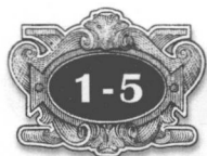
Table of Contents (目錄頁)