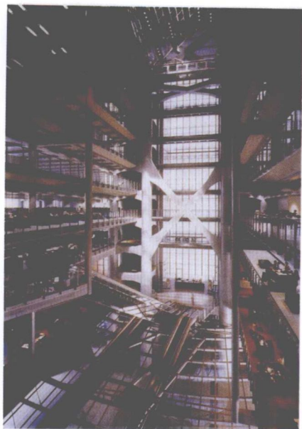
图 1-8 香港汇丰银行内景