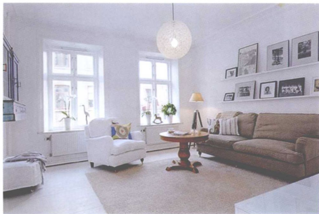
图 1-10 白色派室内空间

白色派的室内朴实无华,室内各界面以及家具等常以白色为基调,简洁明朗,例如,美国建筑师 R. 迈耶设计的史密斯住宅及其室内即属此例。白色派的室内,并不仅仅停留在简化装饰、选用白色等表面处理上,而是具有更为深层的构思内涵,设计师在设计室内环境时,综合考虑室内活动着的人及透过门窗可见的变化着的室外景物,由此,从某种意义上讲,室内环境只是一种活动场所的“背景”,从而在装饰造型和用色上不做过多渲染(见图 1-10)。