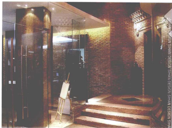
图 1-6 运用青砖和古建筑造型的空间