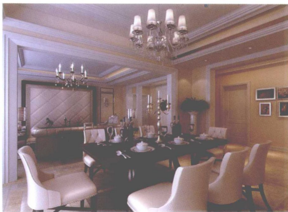
图 1-11 新洛可可派餐厅