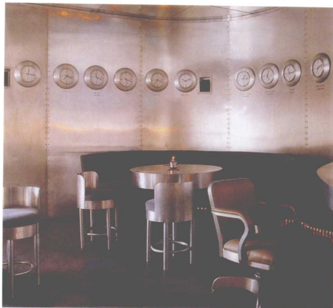
图 1-9 光亮派