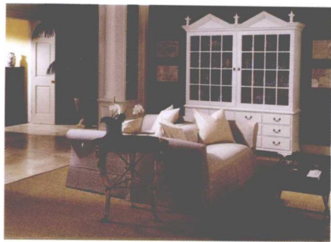
图 1-2 简欧风格