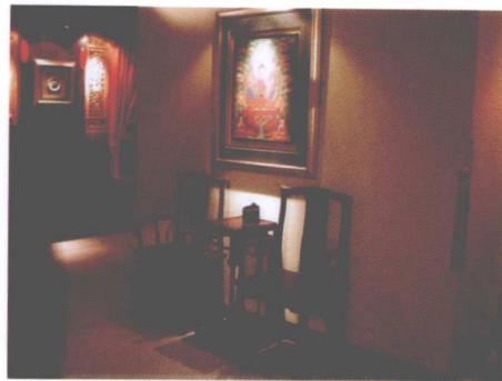
图 1-1 中式传统风格