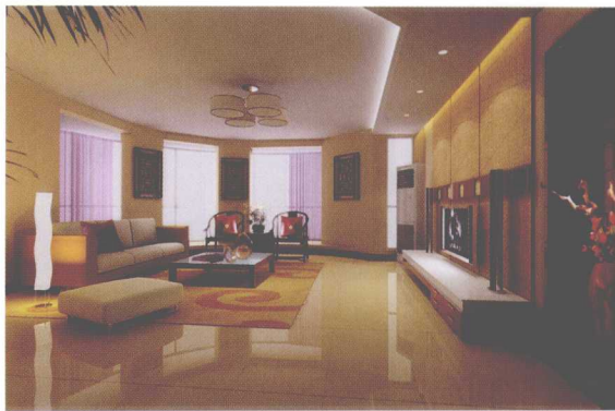
图 1-7 带有中式元素的起居室

近年来,建筑设计和室内设计在总体上呈现多元化、兼容并蓄的状况。室内布置也有既趋于现代实用,又吸取传统的特征,在装潢与陈设中溶古今中外于一体的风格,例如,传统的屏风、摆设和茶几,配以现代风格的墙面及门窗装修、新型的沙发;欧式古典的琉璃灯具和壁面装饰,配以东方传统的家具和埃及的陈设、小品等。混合型风格虽然在设计中不拘一格,运用多种体例,但设计中仍然是匠心独具,深入推敲形体、色彩、材质等方面的总体构图和视觉效果(见图 1-7)。