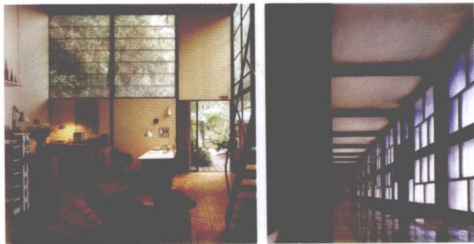
图 1-4 美国加利福尼亚艾米斯住宅内景