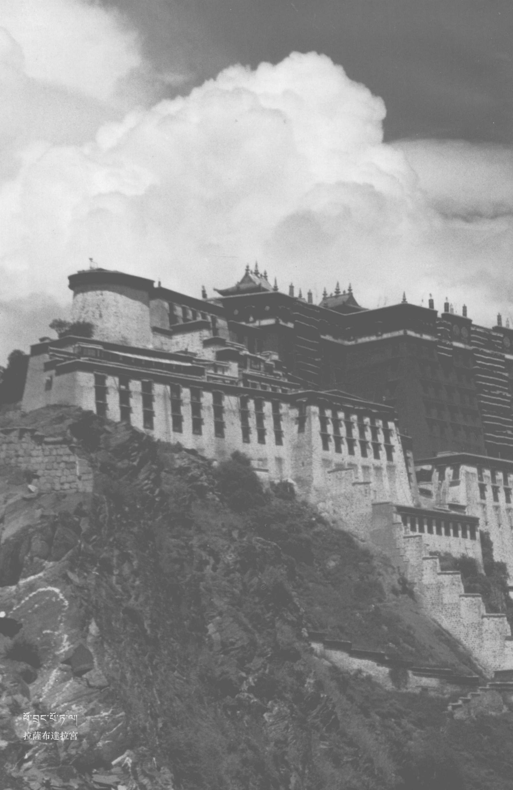
ཕོ་བླང་ཕོ་ཏེ་ལ། 拉薩布達拉宮