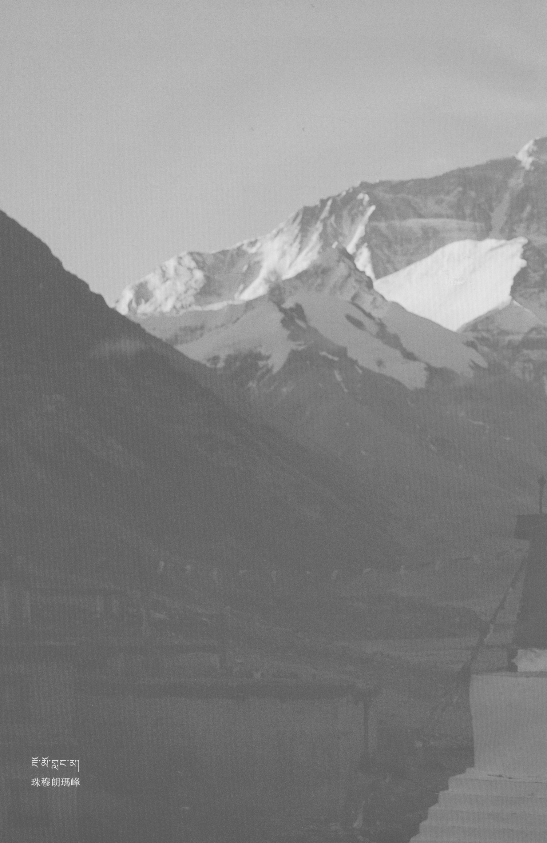
རྫོ་གླང་མ། 珠穆朗瑪峰