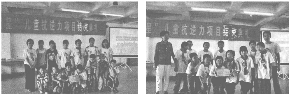
图 1—2 结束典礼后获奖小组合影

举办“抗逆小童星”社会工作实务项目结束典礼（如图1—2），邀请社区工作人员、学校老师、学生家长、流动儿童、建邺区民政局相关领导共同出席。