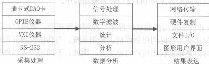
图 1-1 虚拟仪器构成方式

图 1-1 中采集处理模块主要完成数据的调理采集；数据分析模块对数据进行各种分析处理；结果表达模块则将采集到的数据和分析后的结果表达出来。