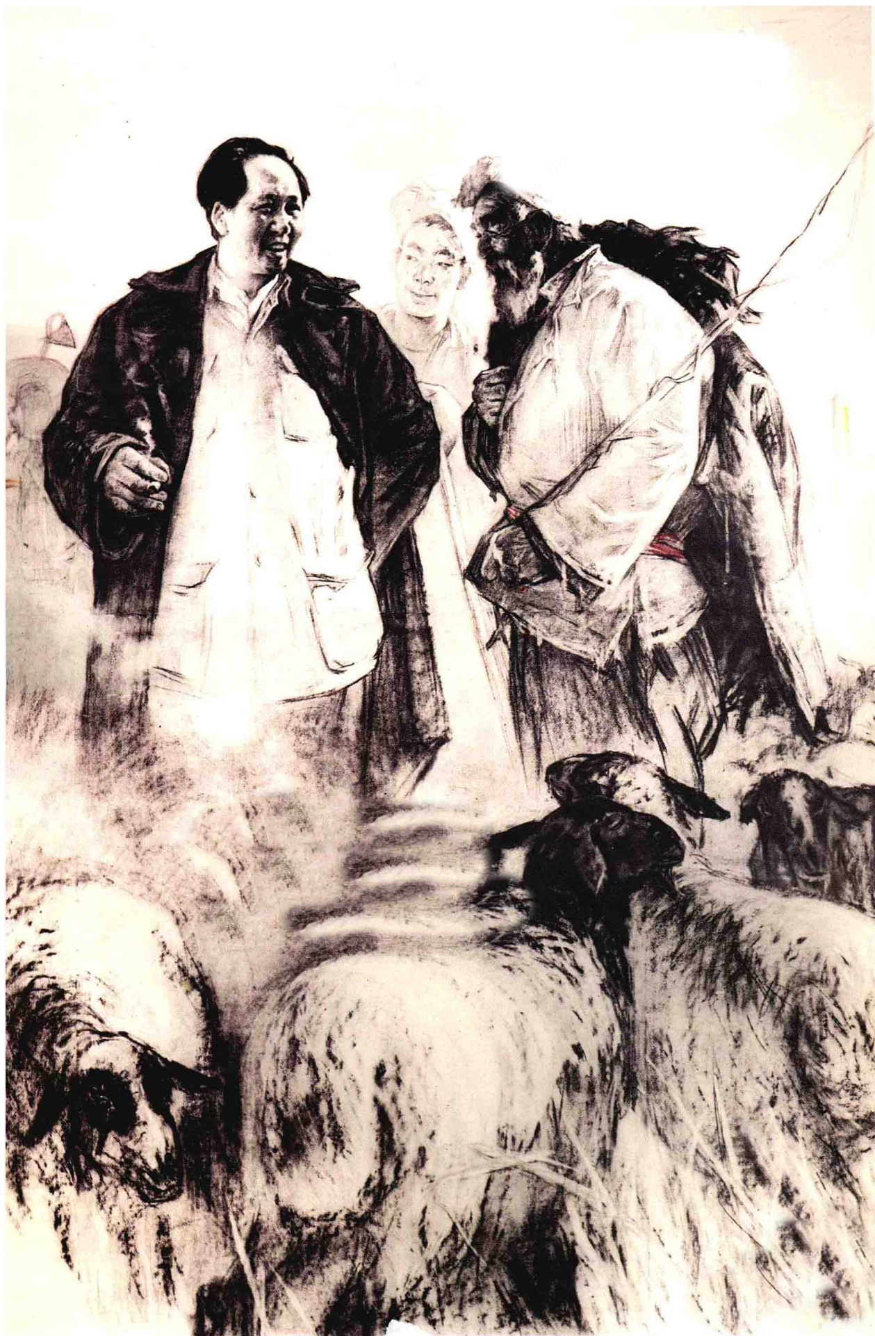
1. 毛主席和牧羊人 H120cm × W80cm 1962