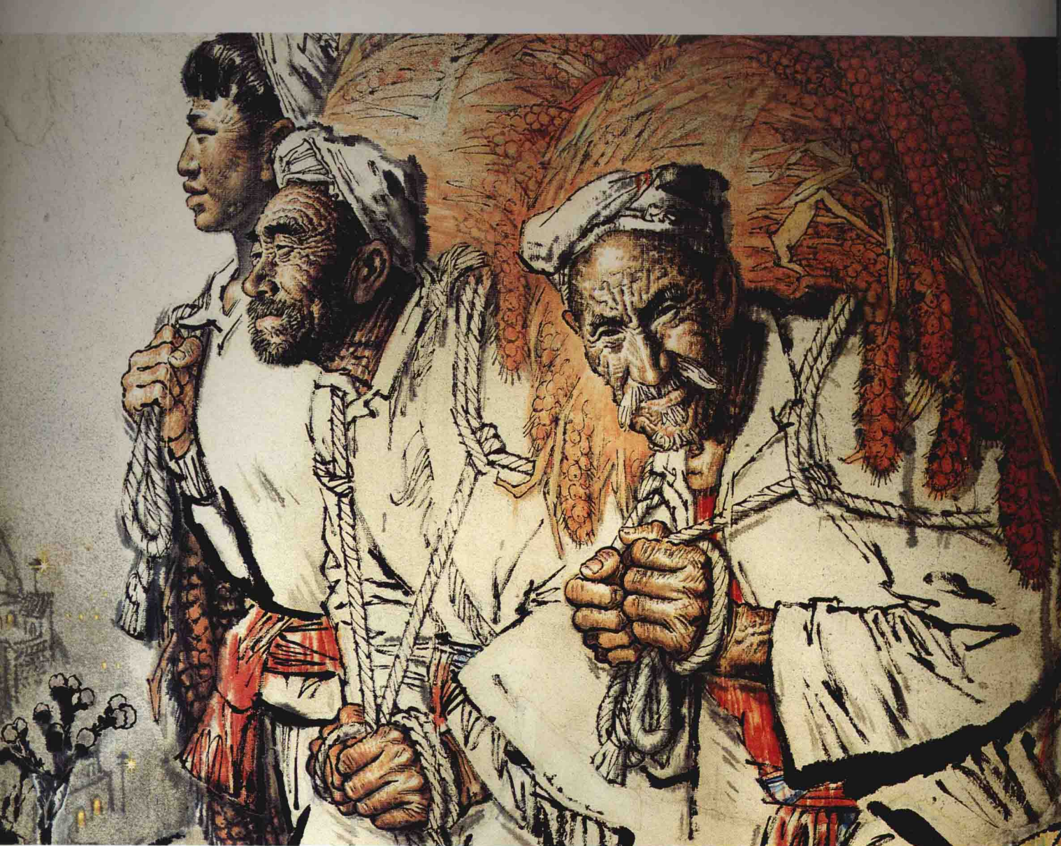
11. 沟里人(局部) H168cm × W133cm 1982