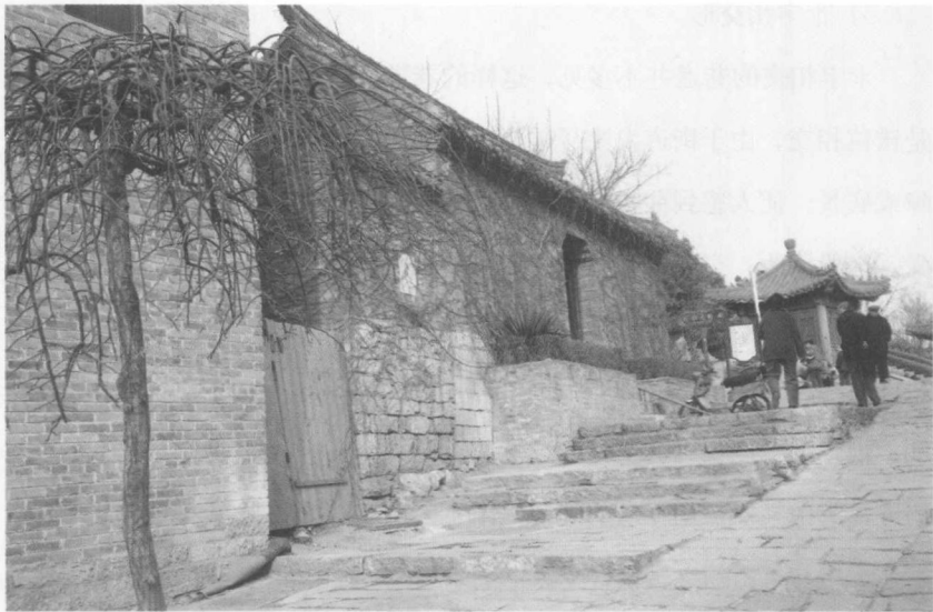
图 1-2 徐州街巷变化的趣味性

无法使人驻足停留，也不能形成中心感和领域感；城市缺乏节点或无法形成观赏点等。相对而言，虽然古代城市规划体系较之现代城市规划格局显得有些僵化，但从封闭的“里坊制”到线状开放的“坊巷制”，再到街巷空间的多层次化和人性化，其合理成分也并不因为时代的发展变化而不复存在，它仍然留给我们很多启示：穿行于巷道之中，一般不会觉得巷道太长，因为巷道形式常发生变化。另外，由于街巷随地形曲折，同时通过骑楼、拱门、门楣以及窗楣，改变建筑物的形体等用以加强空间围合感，改善空间感觉，使空间更加紧凑而又多变，增加了街巷空间变化的趣味性。在现代城镇规划或小区的景观设计中，这无疑是可以借鉴的设计手法。如图1-2所示。