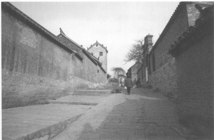
图 1-1 徐州典型的街巷

由于街巷空间基本是由方形或矩形住宅的外缘所界定的，因此，徐州民居巷道多以直线为主。部分由于有水域或水道的存在，曲线形巷道稍多一些。即使因地形限制而必须转折，也多取曲尺形的形式，很少出现斜向交叉的情况。