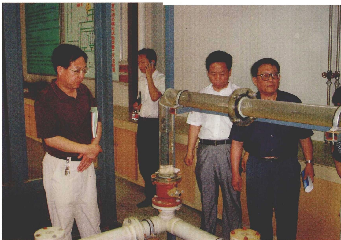
2006年7月，中国工程院院士顾心恽到中心试验现场指导工作