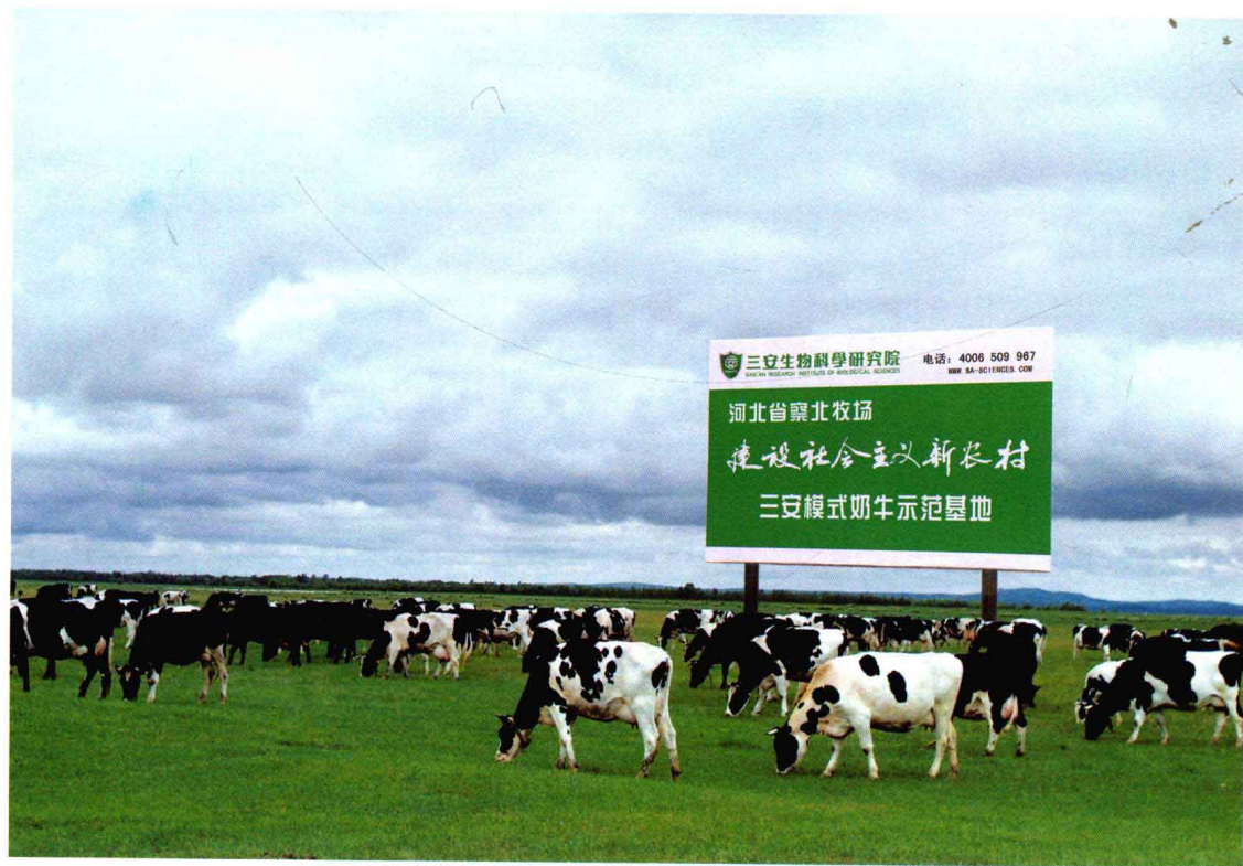
三安模式奶牛示范基地

三安农业所依赖的生物制剂，其主要原料是生活垃圾，或者污水处理产生的污泥、畜禽粪便、植物秸秆、工业糟渣等有机废弃物。采用系列生物制剂把上述废弃物经过除臭、解毒、增效处理后，实现废物资源化，为广大农村营造出高效、高价值的循环经济模式。