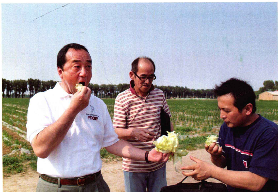
三安蔬菜口味真好！

食品为何不安全？污染的产地环境和依赖投入化学品的生产模式是根源。只要人类不能清除产地环境（如土壤、草原、水环境等）的污染，不能摆脱对化肥、农药、兽药、渔药、激素以及添加剂的依赖，食品安全永远是句空话！三安超有机农业是采用创新生物技术，从环境净化剂到生产过程全部生物化，彻底消灭了化肥、农药、兽药、渔药、激素等各种化学品。确保生产出“零农残”（不得检出）的安全的食用农产品。