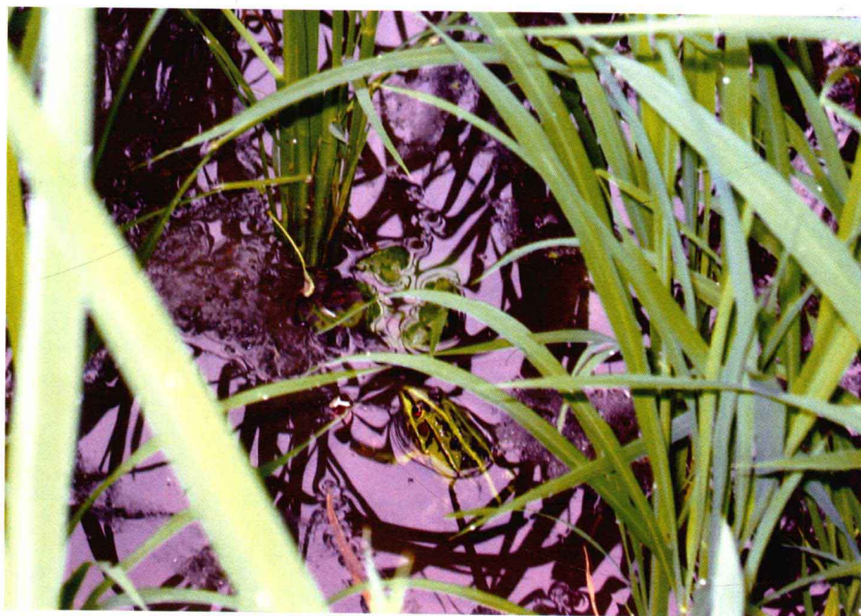
三安模式：水清鱼跃