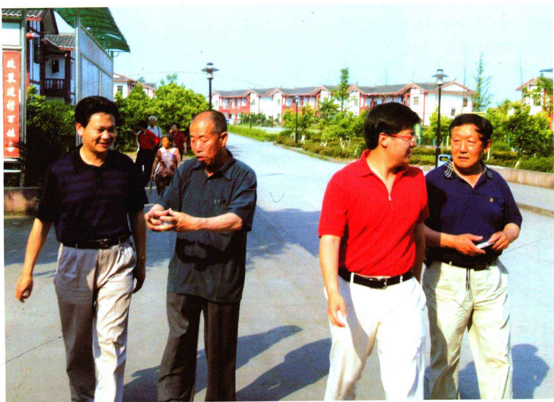
农业专家考察三安农业示范基地

解决食品安全难题，已成为世界各国政府的第一要务。但在无法摆脱对污染环境依赖，对无法摆脱化学品投入的生产方式背景下，破解食品安全永远是不解的难题。创新的三安农业以其创造“零农残”安全食品的优势，抓住了破解食品安全的巨大机遇。