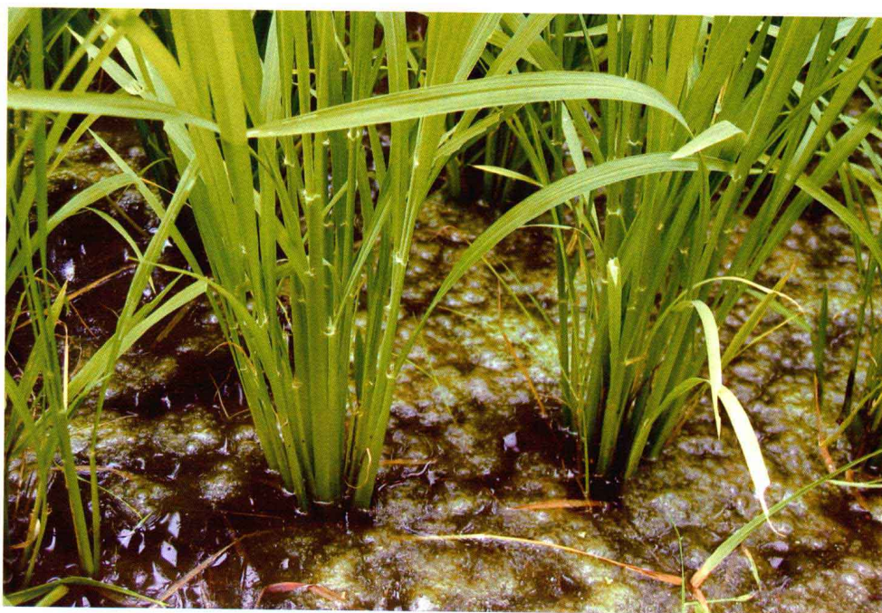
传统模式：污染严重