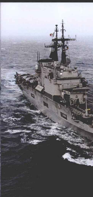
1 韩国“独岛”号轻型航空母舰 4 意大利“加里波第”号航空母舰