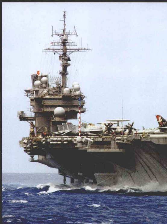
① 美国“小鹰”号航空母舰