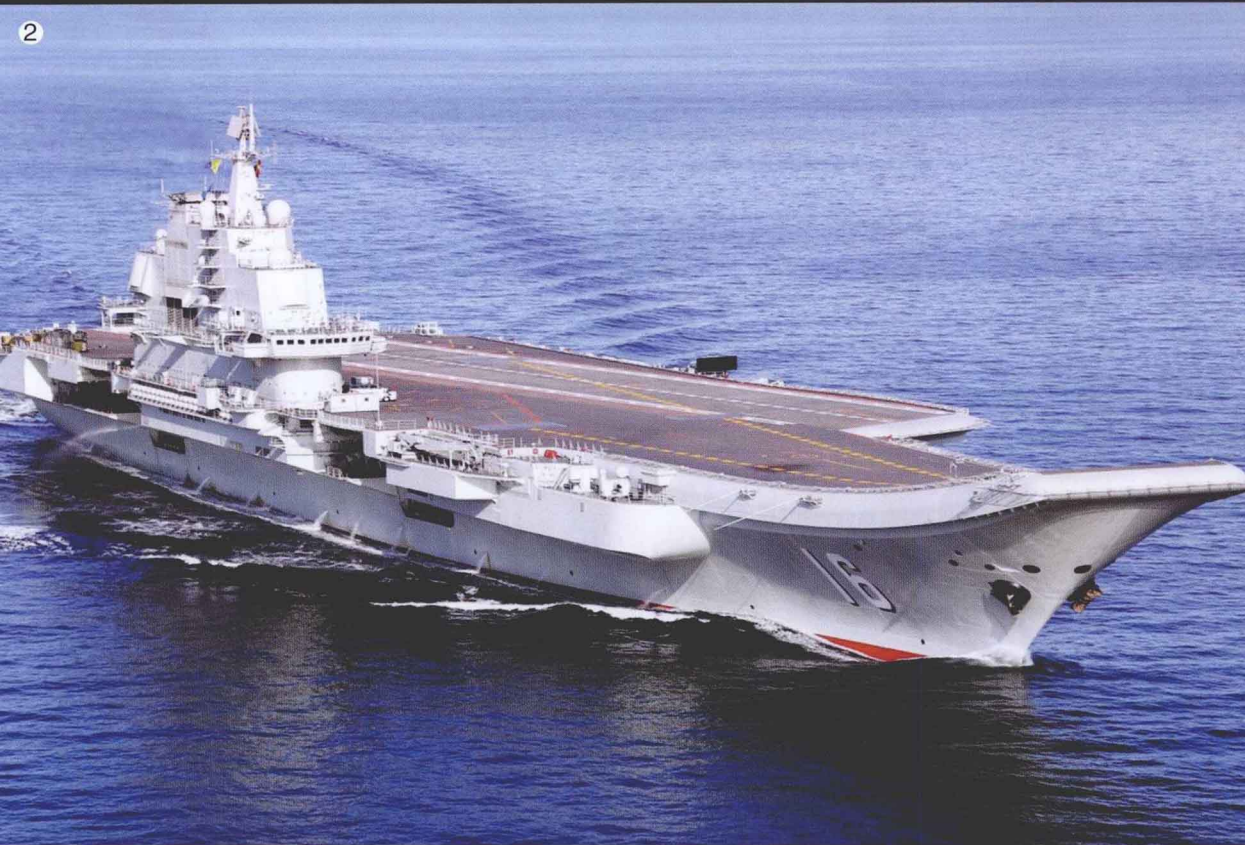
1 在“辽宁”号航空母舰甲板上准备起飞的歼-15 战斗机 2 中国“辽宁”号航空母舰