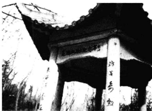
范鸿仙烈士纪念亭

范鸿仙夫妇能够归葬于中山陵园区域内，享受孙中山先生战友的殊荣，实属不易。这是因为范鸿仙追随孙中山从事民主革命，战斗了一生，文韬武略，丰功伟绩，成为历史的伟人。在中山陵园附葬的数百位烈士当中，范鸿仙是最早为孙中山先生的革命事业牺牲的一位烈士。