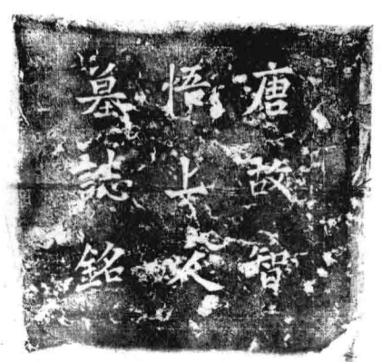
智悟墓誌 2102: 323

智悟墓誌 唐大曆六年十二月二十日葬。陝西藍田出土。拓片誌長、寬均37厘米；蓋長、寬均20厘米。正書。裴適時撰。此拓係林幼梅、張氏柳風堂遞藏本。