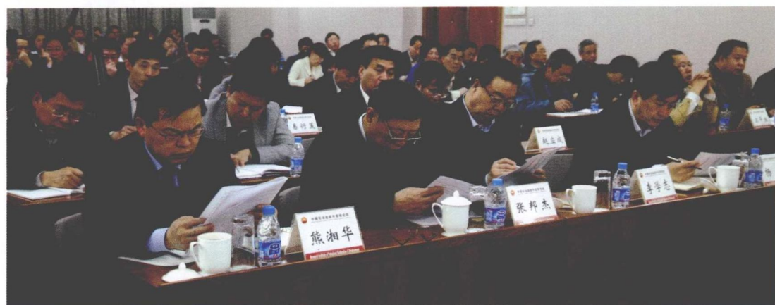
2009年3月20日，召开深入学习实践科学发展观活动动员大会