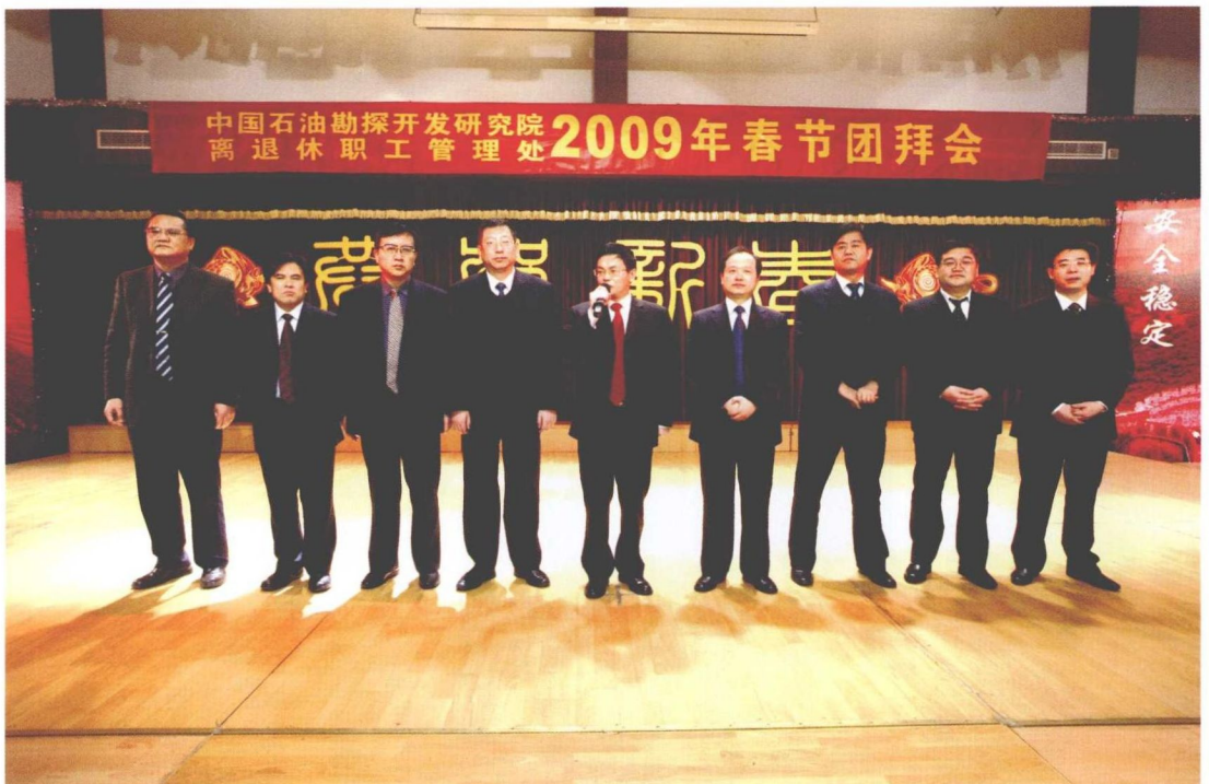
2009年1月21日，院领导班子全体成员参加春节团拜会