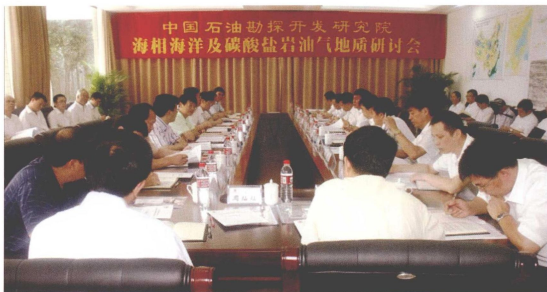
2009年9月2—4日，召开海相海洋及碳酸盐岩油气地质研讨会