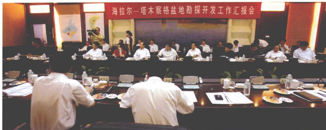
2009年7月21日，院领导赴海塔前线调研检查工作