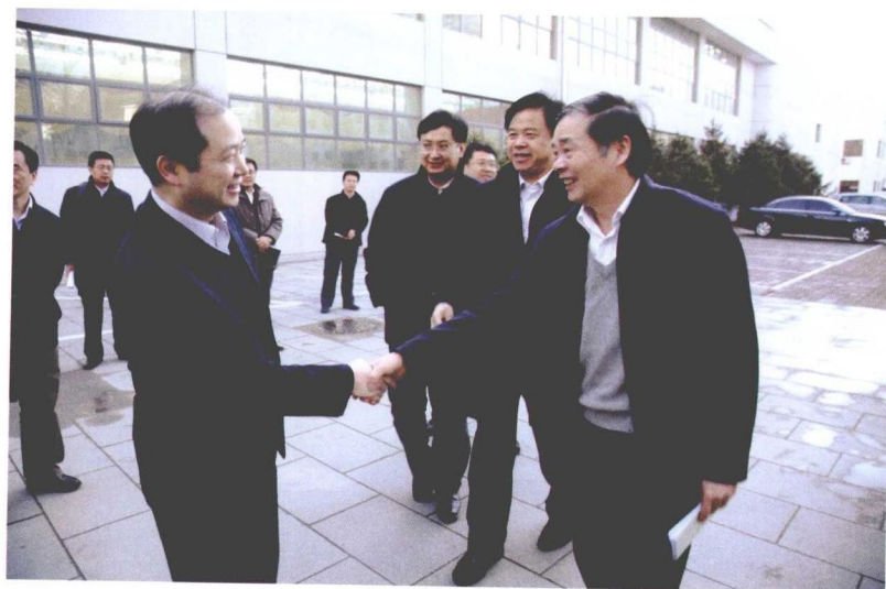
2009年3月5日，国 家工业与信息化部副 部长杨学山(右一) 等同志来院调研指导 工作