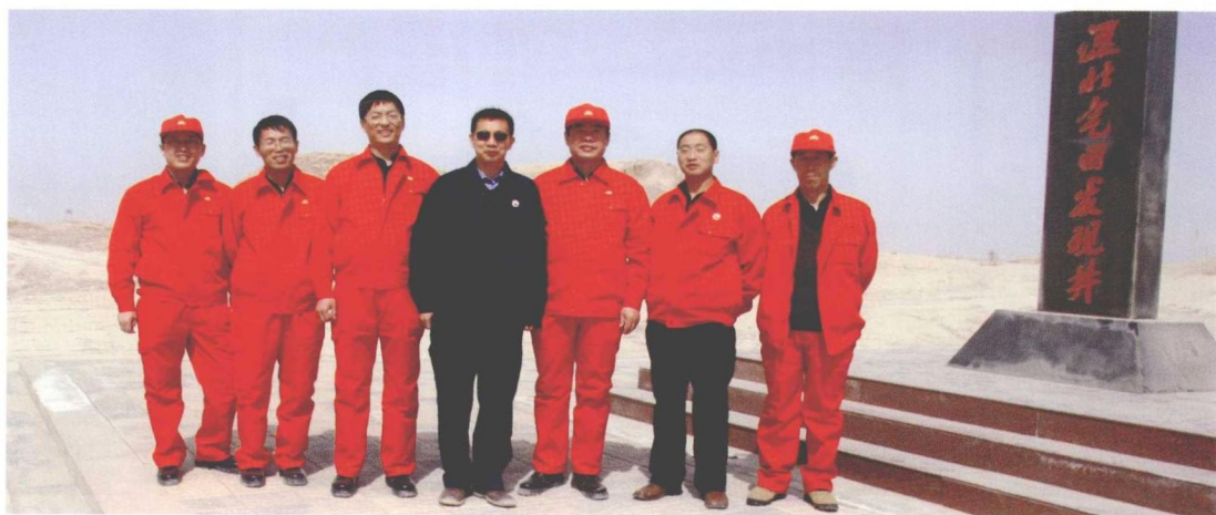
科研人员工作在油田一线