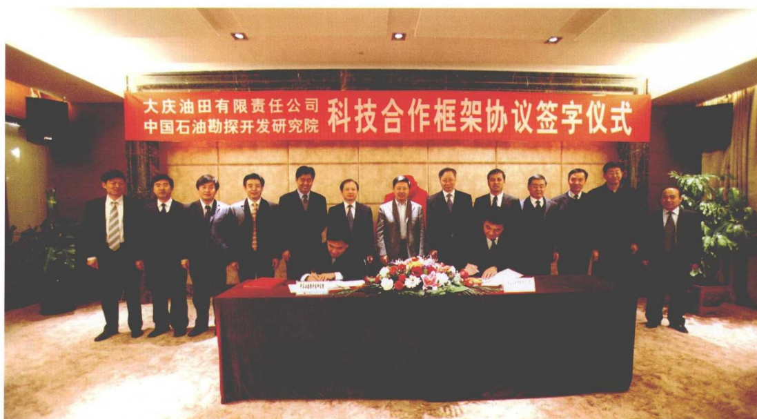
与油气田公司签订科技合作框架协议，成立油田项目部