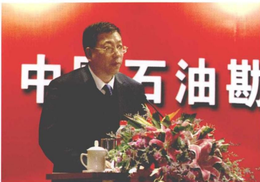
2009年1月14日，召开2009年工作会议