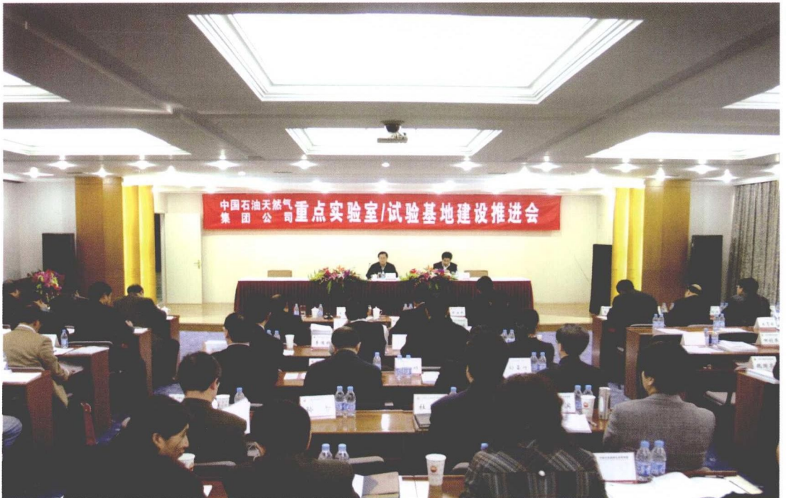
2009年3月24日，集团公司重点实验室推进会在我院举行