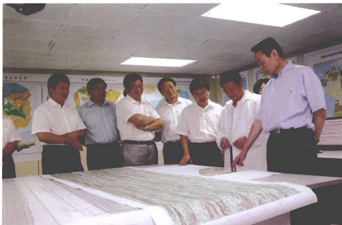
2009年7月24日，中国石油集团公司总经理蒋洁敏同志（右一） 到杭州地质研究院调研指导工作