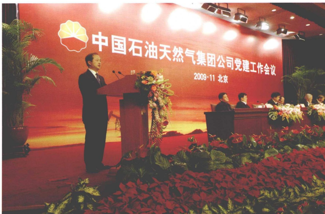
2009年11月2日，周灏书记参加集团公司党建工作会议并作典型发言