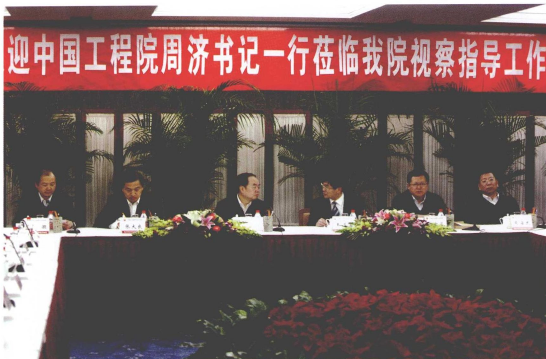
2009年12月23日，中国工程院党组书记周济同志（左三）来院进行人才培养工作调研