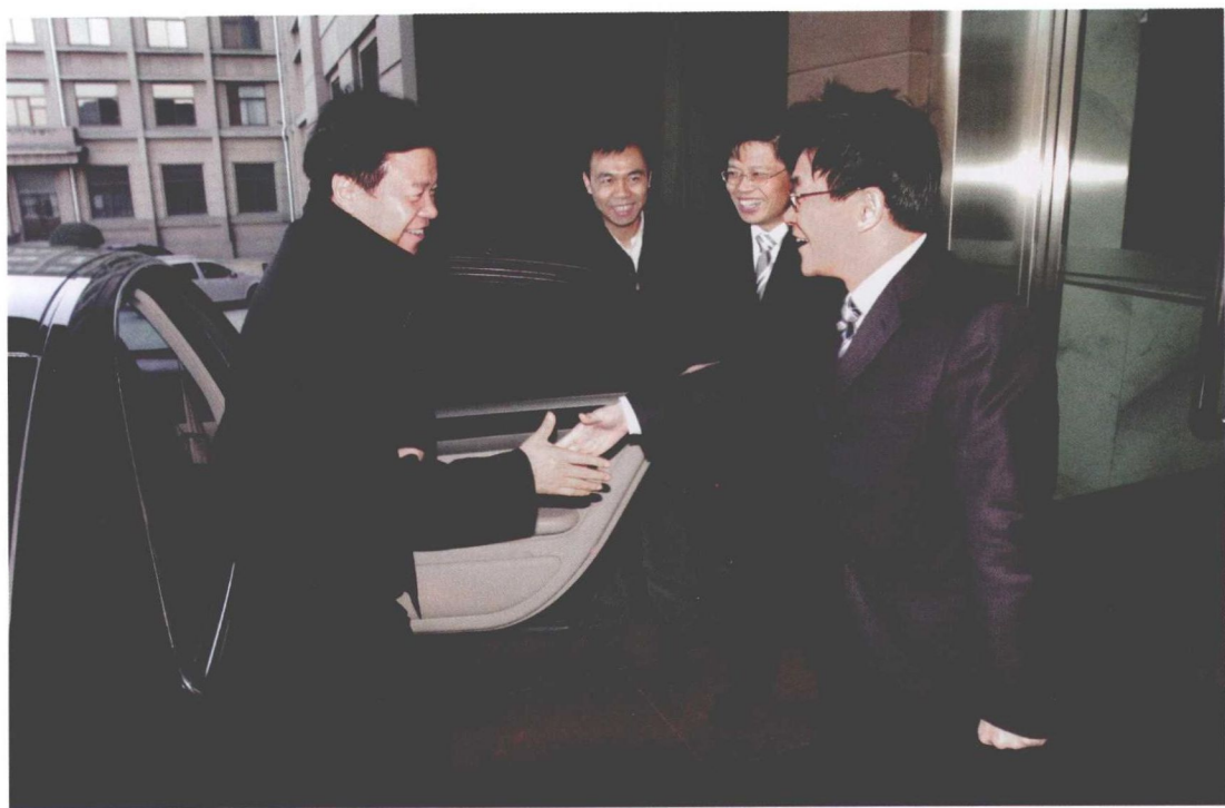
2009年3月5日，中国石油集团公司副总经理王宜林同志（左一）来院调研指导工作