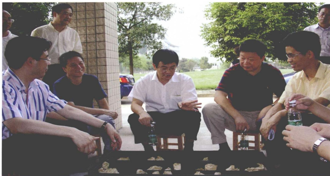
2009年8月26—28日，院领导赴西南油气田分公司开展现场调研