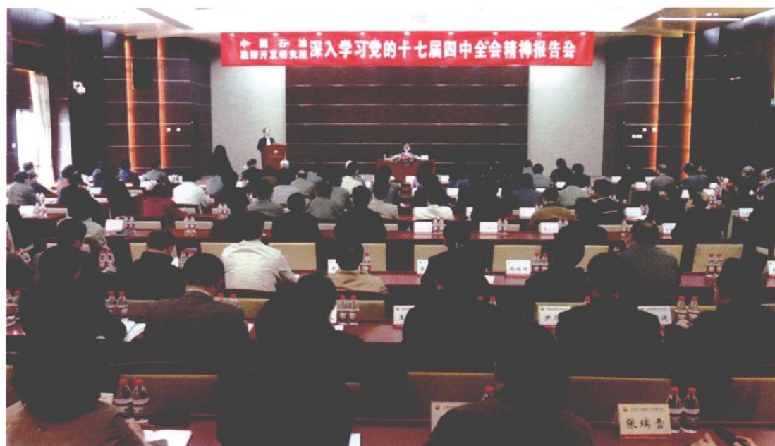
2009年10月27日，召开深入学习党的十七届四中全会精神报告会