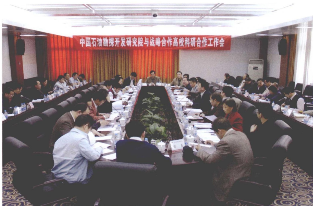
2009年4月16日，召开战略合作高校科研合作工作会