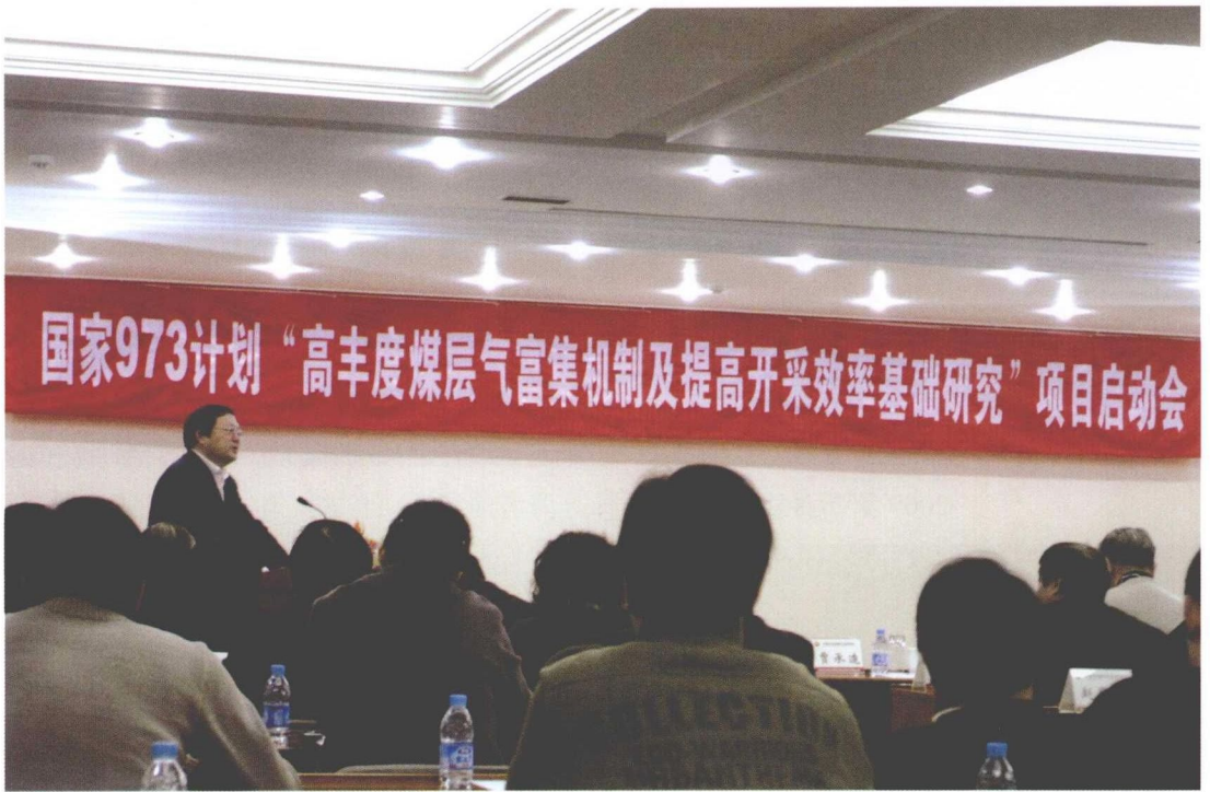
2009年2月12日，国家973项目启动会在我院举行