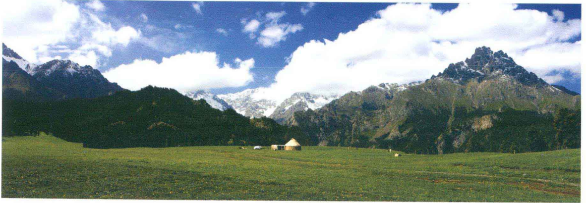
沙湾美丽的鹿角湾