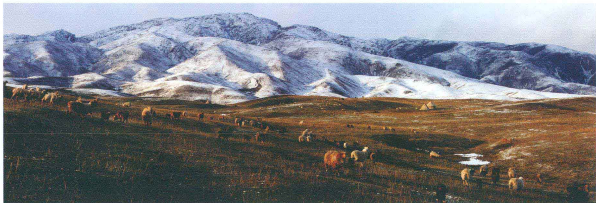
塔尔巴哈台山春牧