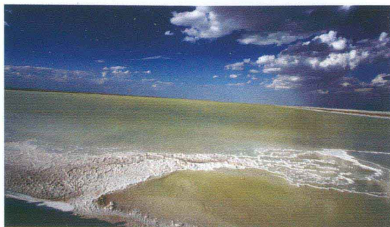
和布克赛尔盐池风光

庭都护府。1763年，清政府在雅尔（今哈萨克斯坦乌尔扎尔）设塔尔巴哈台军台，次年筑肇丰城，塔尔巴哈台参赞大臣驻防。1766年移至今塔城市筑城，乾隆皇帝赐名“绥靖”，由伊犁将军节制。光绪十四年（1888年）始置塔城直隶厅。1916年，裁撤塔尔巴哈台参赞大臣，设塔城道，辖塔城、乌苏、沙湾三县。1945年8月，“三区革命”临时政府塔城专员公署成立。1950年8月，设塔城专区，专署驻塔城县，辖塔城、裕民、额敏、和丰、沙湾、乌苏6县。1951年由额敏县析置托里中心区。1970年塔城专区改称塔城地区，地区驻塔城县，辖塔城、乌苏、托里、裕民、额敏、沙湾、布克赛尔蒙古自治县。1976年将沙湾县划归石河子地区。1978年原石河子地区