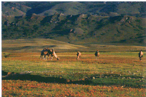
额敏孟布拉克风光

所属沙湾县划入塔城地区。1984年11月17日，国务院批准撤销塔城县，设立塔城市。1996年7月10日，国务院批准撤销乌苏县，设立乌苏市。现塔城地区辖塔城、额敏、裕民、托里、乌苏、沙湾、和布克赛尔5县2市。区内还有新疆生产建设兵团农七、八、九、十师所属的36个农垦团场。