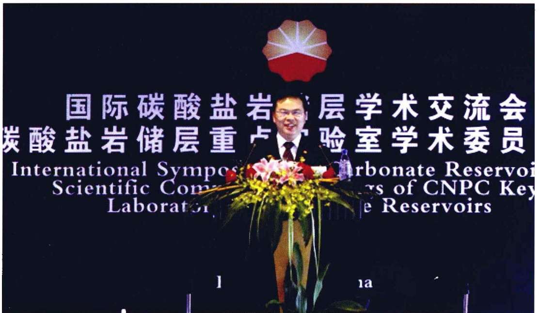
2010年10月24—25日，国际碳酸盐岩储层学术交流会在杭州召开