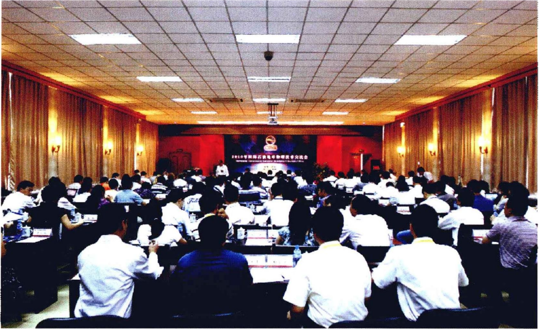
2010年7月23—24日，2010年国际石油地球物理 技术交流会（CEG）在兰州召开