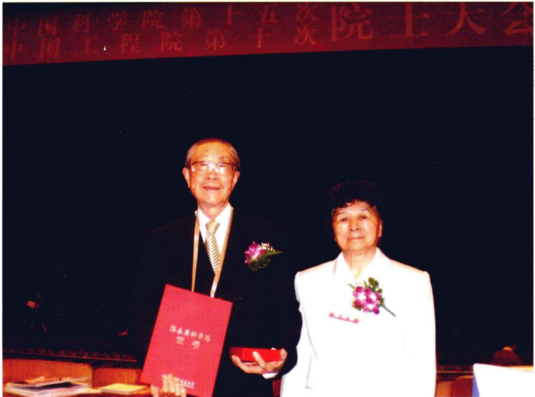
2010年6月9日，李德生院士获陈嘉庚地球科学奖