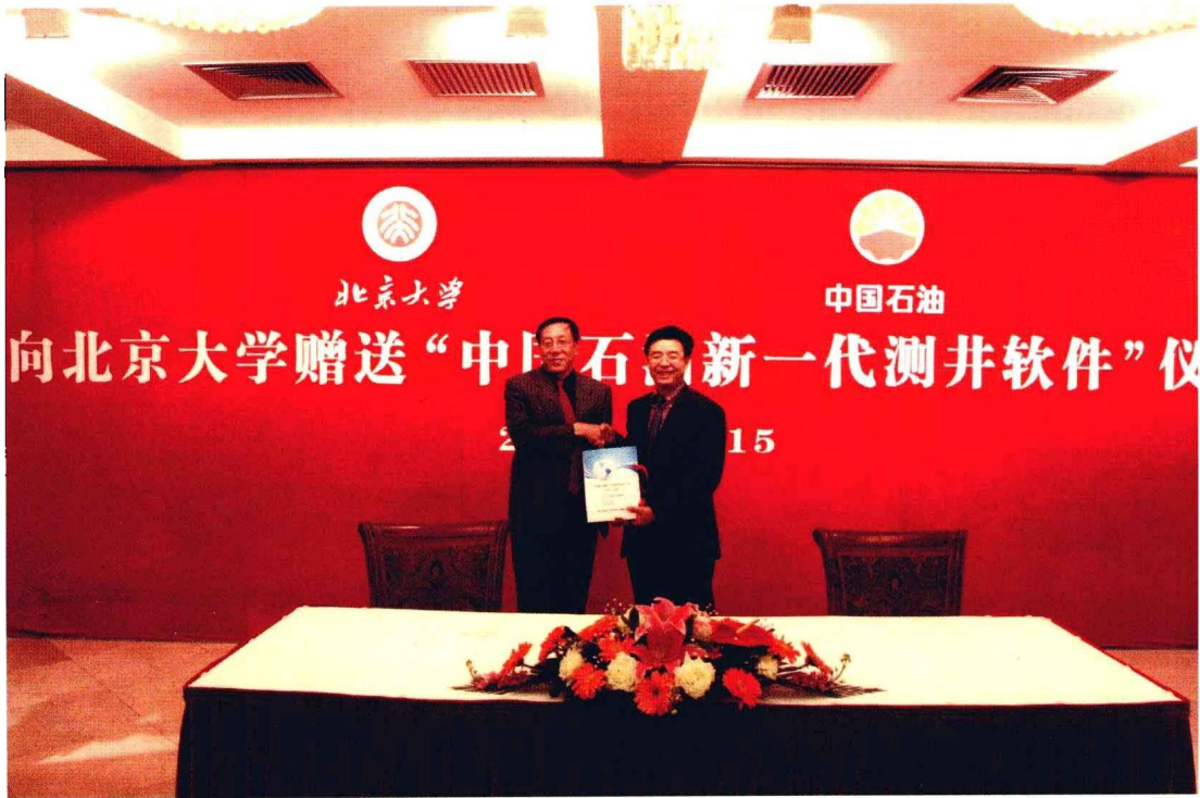
2010年12月15日，研究院向北京大学赠送中国石油新一代测井软件 CIFLog1.0