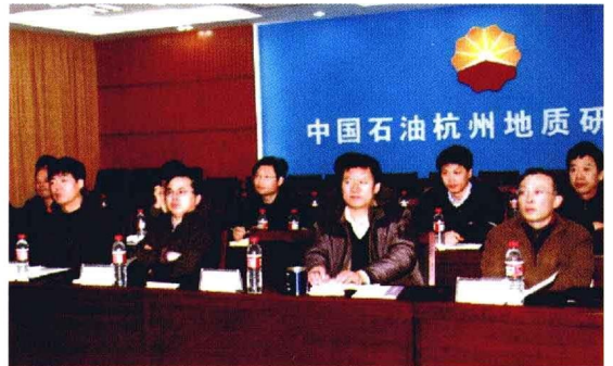
2010年3月11日，研究院举办院处两级中心组学习活动