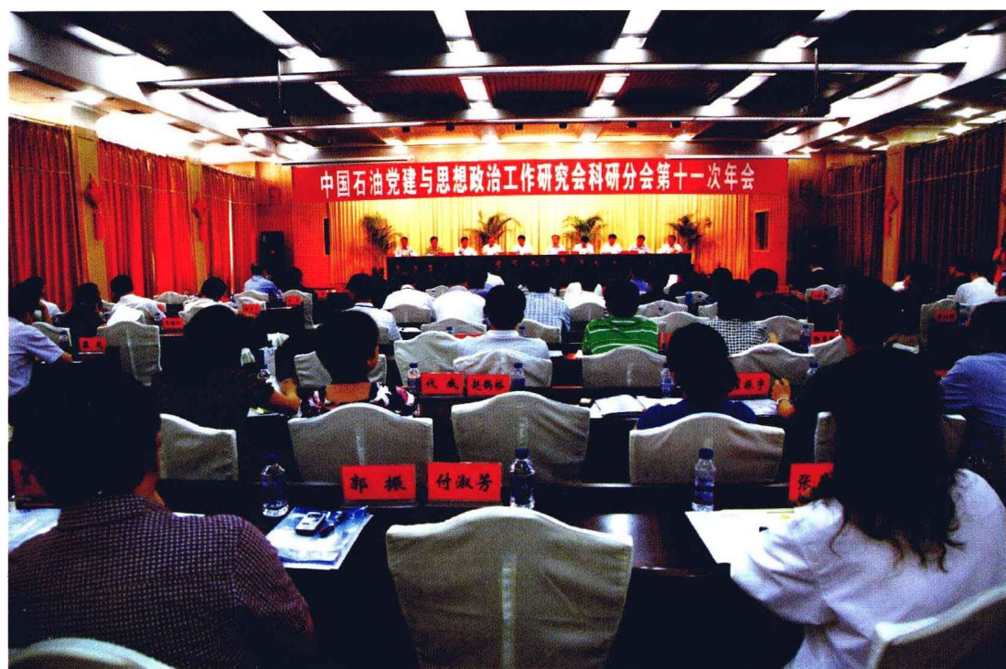
2010年6月23—24日，中国石油党建 与思想政治工作研究会第十一次年会在辽河油田召开