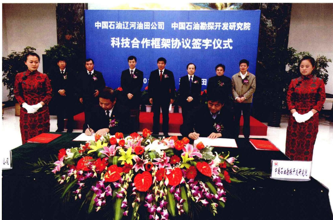
2010年3月2日，研究院与辽河油田公司签署科技合作框架协议