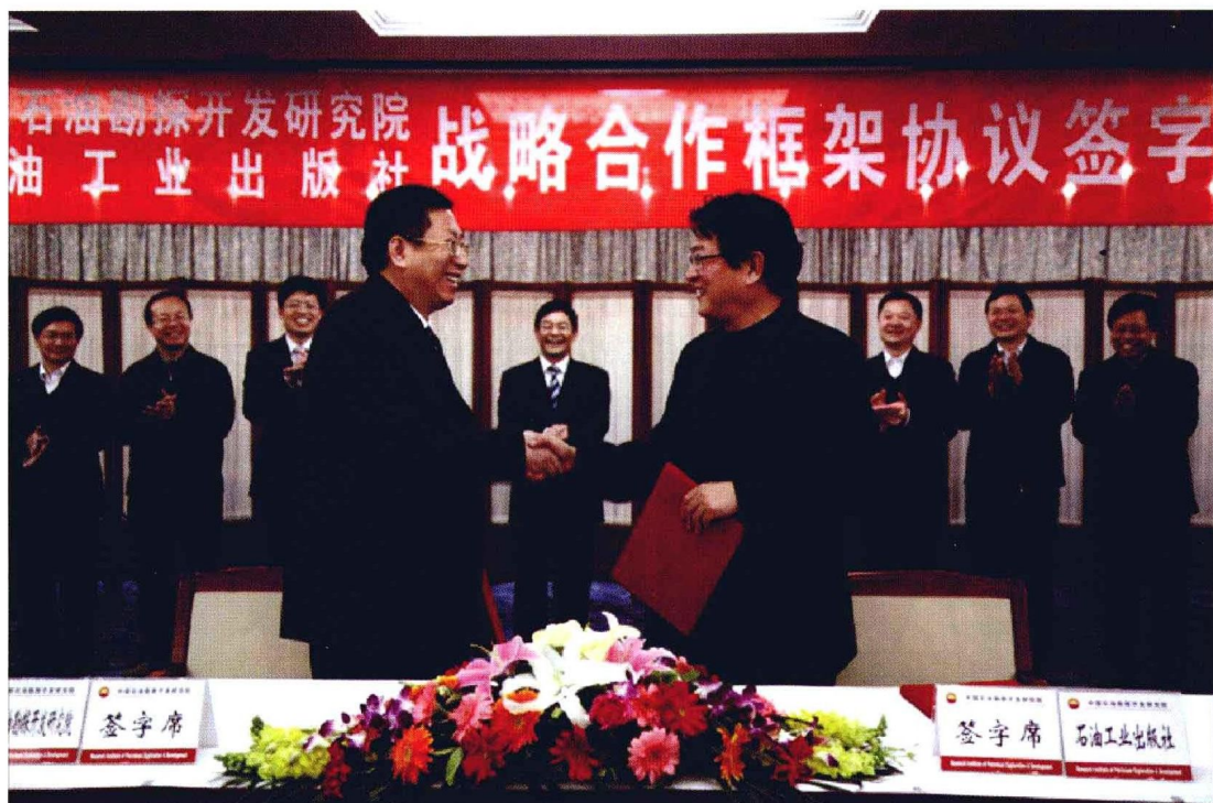
2010年4月16日，研究院与石油工业出版社签订战略合作框架协议