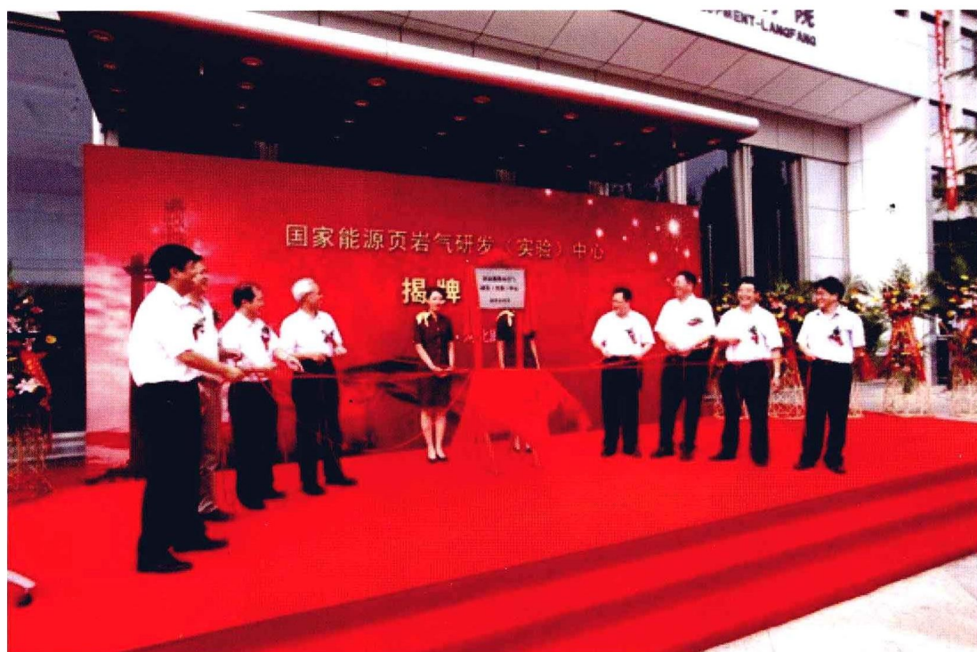
2010年8月20日，国家能源页岩气研发（实验）中心在廊坊分院揭牌