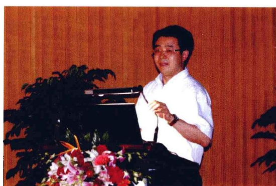
2010年7月7日，研究院召开学科建设推进会