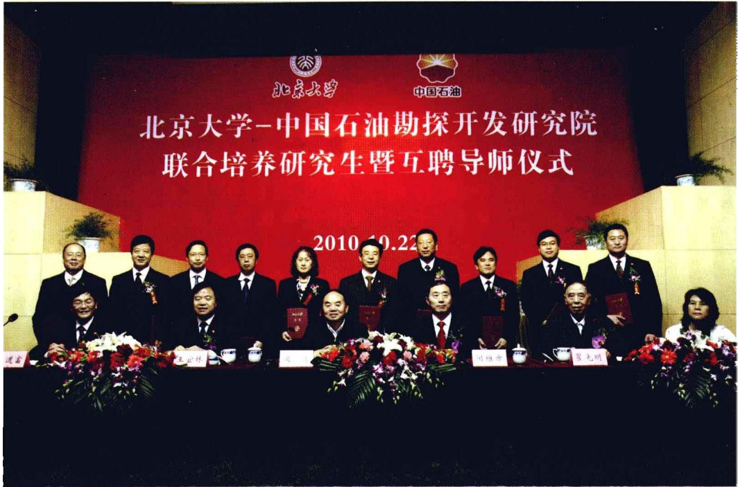
2010年10月22日，中国工程院院长、党组书记周济同志出席北京大学与中国石油勘探开发研究院联合培养研究生暨互聘导师仪式