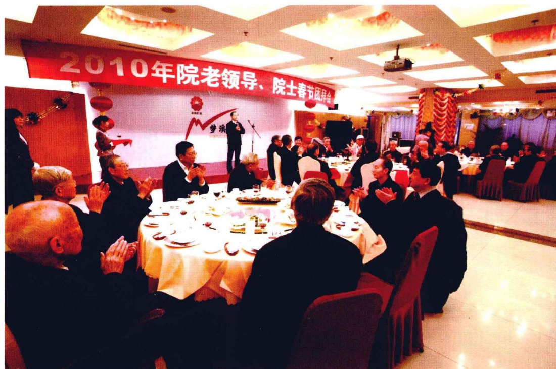
2010年2月10日，研究院举办2010年老领导、院士春节团拜会