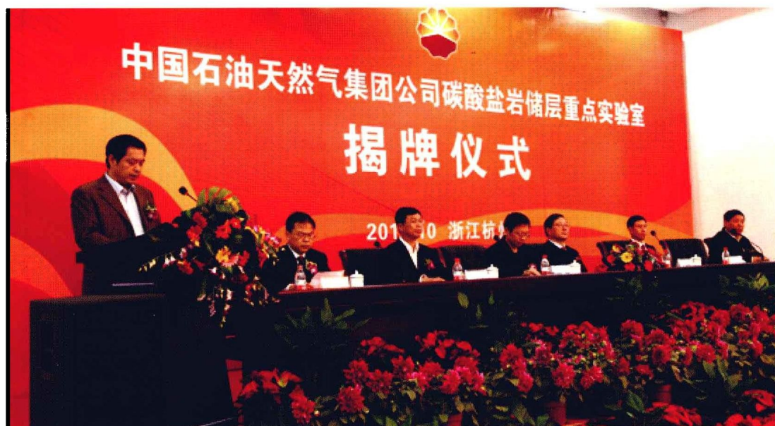
2010年10月25日，集团公司碳酸盐岩储层重点实验室在杭州地质研究院揭牌