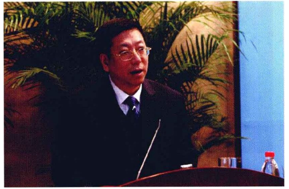
2010年2月1日，研究院2010年工作会议召开