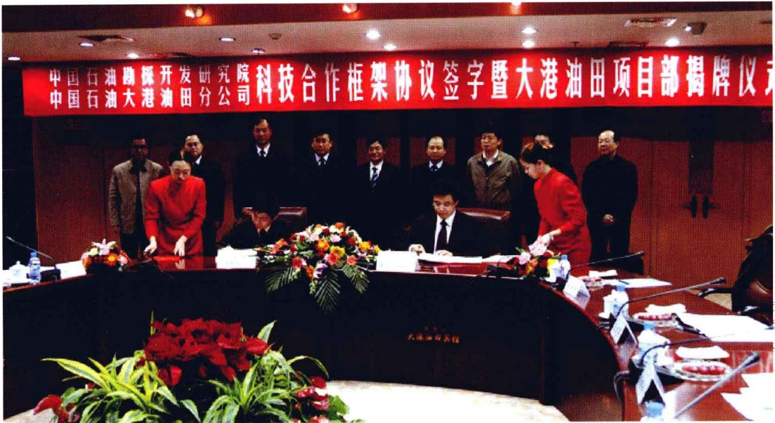
2010年1月19日，研究院与大港油田公司签订科技合作框架协议