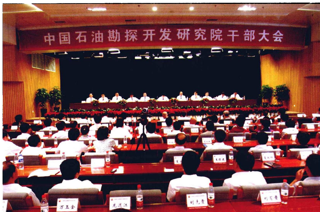
2010年7月12日，研究院干部大会召开