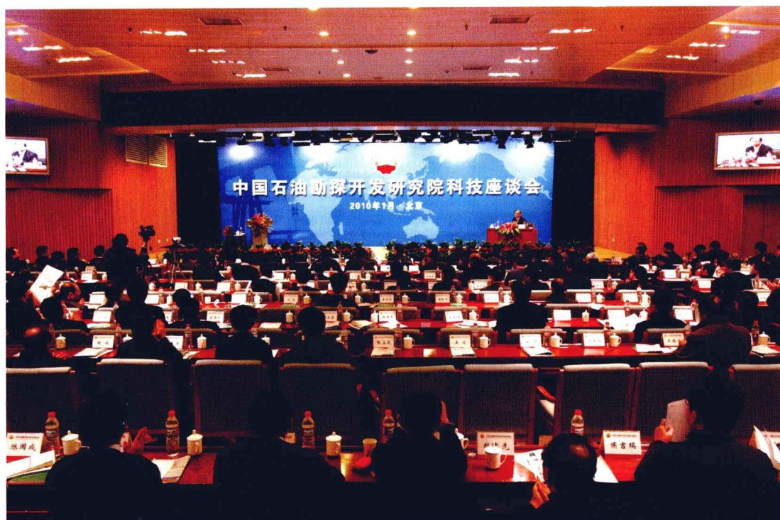
2010年1月6日，研究院首届科技座谈会召开