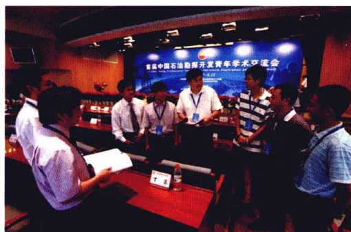
2010年9月8—10日，首届中国石油勘探开发青年学术交流会召开