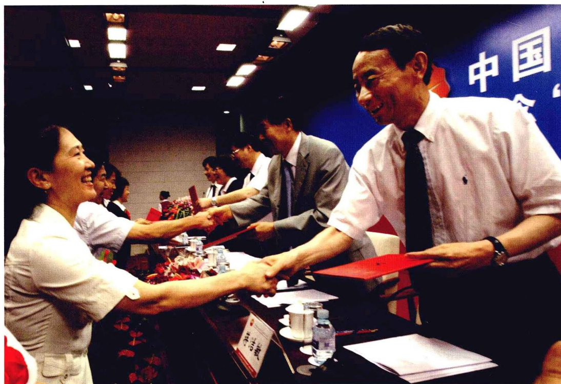
2010年7月1日，集团公司直属机关隆重召开纪念七一暨创先争优活动表彰动员大会。集团公司党组书记、总经理蒋洁敏出席会议并向获得先进称号的集体和个人颁奖。