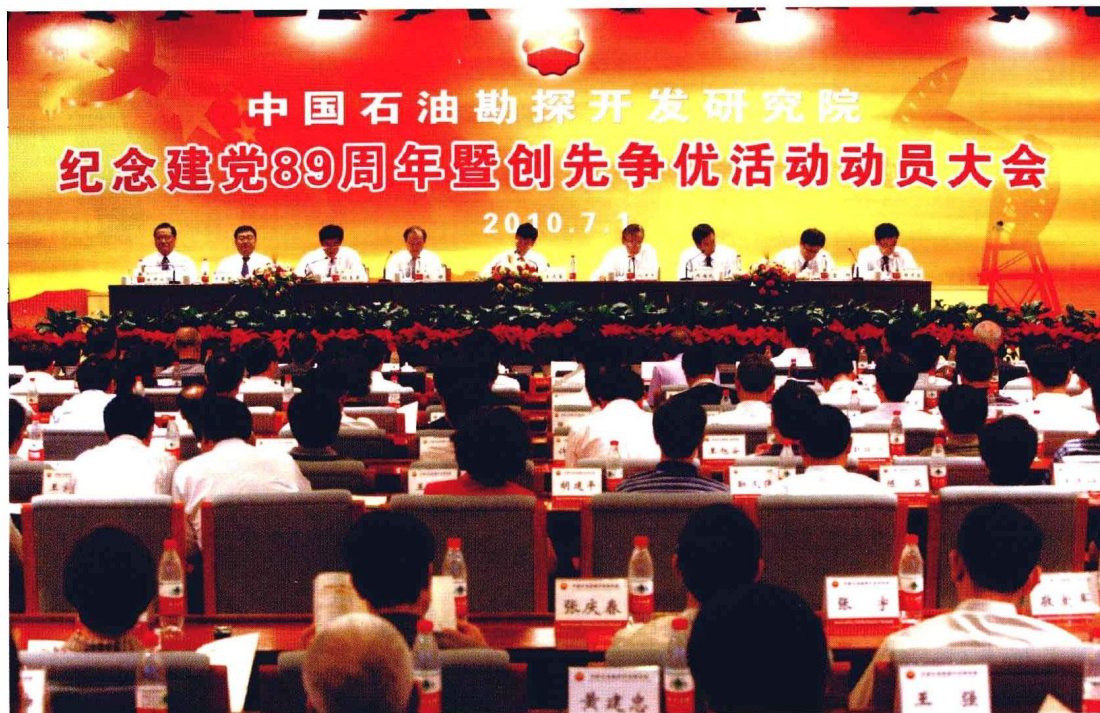
2010年7月1日，研究院隆重举行纪念建党89周年暨创先争优活动动员大会