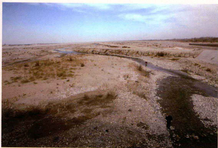
传统的在河床里摸玉的方式，对白玉河的生态环境不会造成太大的影响

和田玉的开采一般有两种方式：一种是开采山料，称“攻玉”，就是在昆仑山上有原生玉矿的成矿地带，每年5月至8月天气转暖时，采玉人登昆仑雪山之巅掘坑取玉。另一种是在河流上、下游拣玉或挖玉。玉龙喀什河上游有条支流叫汉尼拉克河，它的尽头是现代冰川，称阿格居改。阿格居改的雪山处在玉矿的断裂带上，这里的冰川年复一年地侵蚀着玉矿带，将玉料挟带到河谷中。由于冰川搬运作用而形成的块状玉料，既不像山料那样棱角分明，也不像籽料那样圆滑鲜润，而是介于两者之间，称“山流水”。