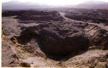
机械化的开挖方式一度将玉龙喀什河两岸破坏得面目全非

和田玉的开采一般有两种方式：一种是开采山料，称“攻玉”，就是在昆仑山上有原生玉矿的成矿地带，每年5月至8月天气转暖时，采玉人登昆仑雪山之巅掘坑取玉。另一种是在河流上、下游拣玉或挖玉。玉龙喀什河上游有条支流叫汉尼拉克河，它的尽头是现代冰川，称阿格居改。阿格居改的雪山处在玉矿的断裂带上，这里的冰川年复一年地侵蚀着玉矿带，将玉料挟带到河谷中。由于冰川搬运作用而形成的块状玉料，既不像山料那样棱角分明，也不像籽料那样圆滑鲜润，而是介于两者之间，称“山流水”。