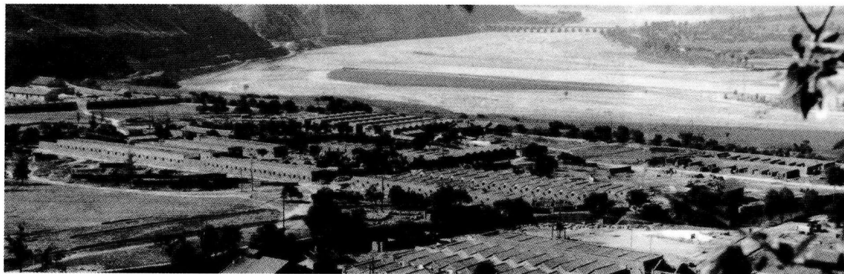
▶ 20世纪70年代，长庆桥基地

长庆油田勘探开发建设是在艰苦的环境、困难的条件下进行的。鄂尔多斯盆地及其周缘面积约37万平方千米，大部分地处沟壑纵横、山高坡陡的黄土高原，北有沙漠、半草原分布，地形独特，交通不便。地下沉积岩，自新元古界至新生界新近系系累计厚度约两万米，已探明的两套含油层系中，侏罗系延安组、三叠系延长组为河流、湖沼相沉积，受沉积环境影响，岩相变化大，油砂体小而分散，均属低渗透、特低渗透油藏。