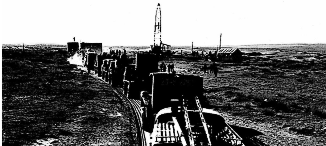
▶ 红井子会战，挺进宁夏大水坑