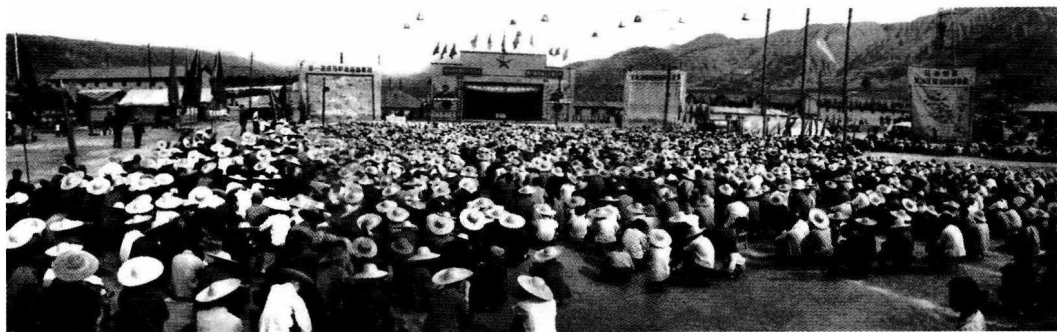
▶ “五路会战”动员誓师大会