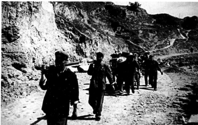
▶ 油田产能建设靠人拉肩扛

特别是1971年6月5日至14日，十六团二连（后称油建二中队）127名战士，为了早日投入油田大会战，克服运输车辆不足的困难，从陕西咸阳用人拉着22辆满载工具、行李的架子车，行径陕西、甘肃两省7县300余里，到庆阳马岭的阜城建点，成为“跑步上陇东”最经典的