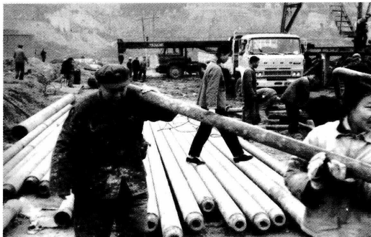
▶ 军民人拉肩扛搞会战

长庆油田勘探开发建设是在艰苦的环境、困难的条件下进行的。鄂尔多斯盆地及其周缘面积约37万平方千米，大部分地处沟壑纵横、山高坡陡的黄土高原，北有沙漠、半草原分布，地形独特，交通不便。地下沉积岩，自新元古界至新生界新近系系累计厚度约两万米，已探明的两套含油层系中，侏罗系延安组、三叠系延长组为河流、湖沼相沉积，受沉积环境影响，岩相变化大，油砂体小而分散，均属低渗透、特低渗透油藏。