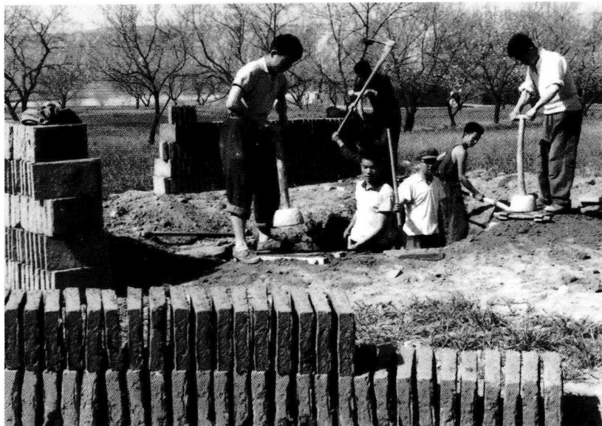
► 会战职工在建宿舍——“干打垒”

创业会战及开发建设初期，长庆油田依靠科技进步，实事求是，开拓前进，初步形成了勘探开发建设低渗透油田的工艺技术。至1979年底，共取得多项科技成果，分别获得国家技术发明奖、国家科技进步奖、国家“六五”科技攻关先进项目奖、石油工业优秀科技成果奖、石油部科学技术进步奖等多个奖项。