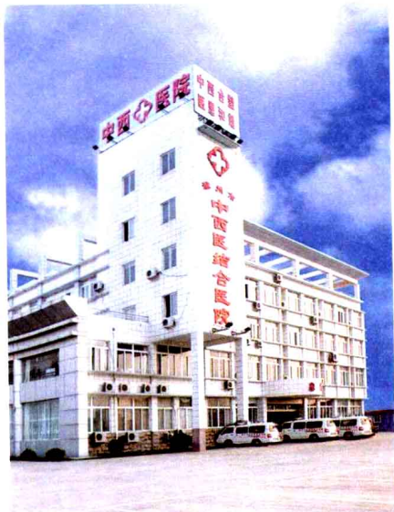
图3 中医、西医、中西医结合三支力量并存是中国卫生事业的特色