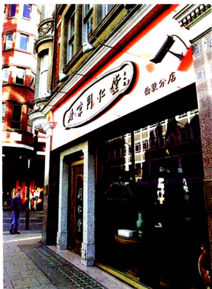
图1 唐人街的中药店

不滥用消炎、止痛药是对的。这类药物有一定副作用，按照医学原则除非有必要才合理使用。不过，像这种情况，如果在中国，老百姓会有另外的处理方法，比如贴一帖止痛膏药，擦一点跌打酒、万花油，或者去做几次针灸、按摩，同样也不用吃药，但比消极休息好得更快、更彻底，而且也没有副作用。