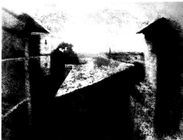
图1-1 尼埃普斯肖像和照片《窗外》

(Heliography)。他的摄影方法，比达盖尔早了十几年，实际上应被称为摄影术的发明者，只是由于尼埃普斯为保密而一直拒绝公开，也就未被予以公认。