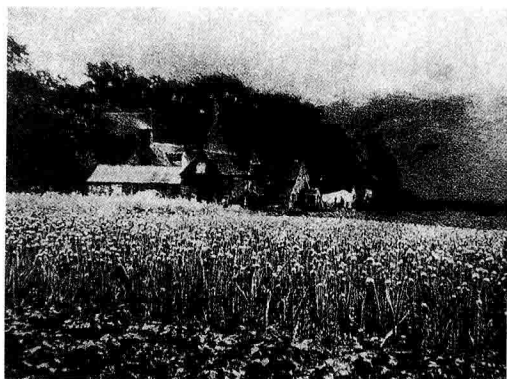
图1-8 葱田 乔治·戴维森 摄

特别是1894年采用的树胶重铬酸盐印相工艺，更加拓宽了印象派的表现天地。有些印象派摄影家甚至在照片上使用画笔以加强和丰富朦胧的画意效果。某些自然主义摄影的追随者为了画意，更是夸大了埃默森的焦点视觉理论，甚至激进到可以不考虑是否有焦点的程度，如采取不用镜头而是针孔成像的方法。英国的乔治·戴维森的作品《葱田》（图1-8）便是针孔成像的一个典例。