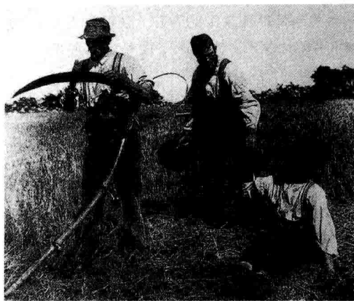
图1-7 收获 彼得·埃默森 摄

19世纪80年代，伴随着高艺术摄影的衰落，写实风格的画意摄影——自然主义摄影出现。自然主义摄影随艺术上的自然主义思潮出现，代表人物英国的彼得·埃默森，1889年著有《自然摄影》，代表作《收获》（图1-7）。在这本书中，阐述了自然主义摄影的理论体系：摄影应是一门独立的艺术，是艺术与科学的结合；摄影艺术可以由自然环境中的自然题材，通过取景、构图、用光和选择调焦的直接记录来实现；焦点视觉理论，即人眼视场的中间部分是清晰的，而边缘部分是模糊的，为达到人眼的视觉再现，则焦点不必完全准确。在不破坏拍摄对象的结构和形象的前提下，对焦可以有适当的模糊和变化。