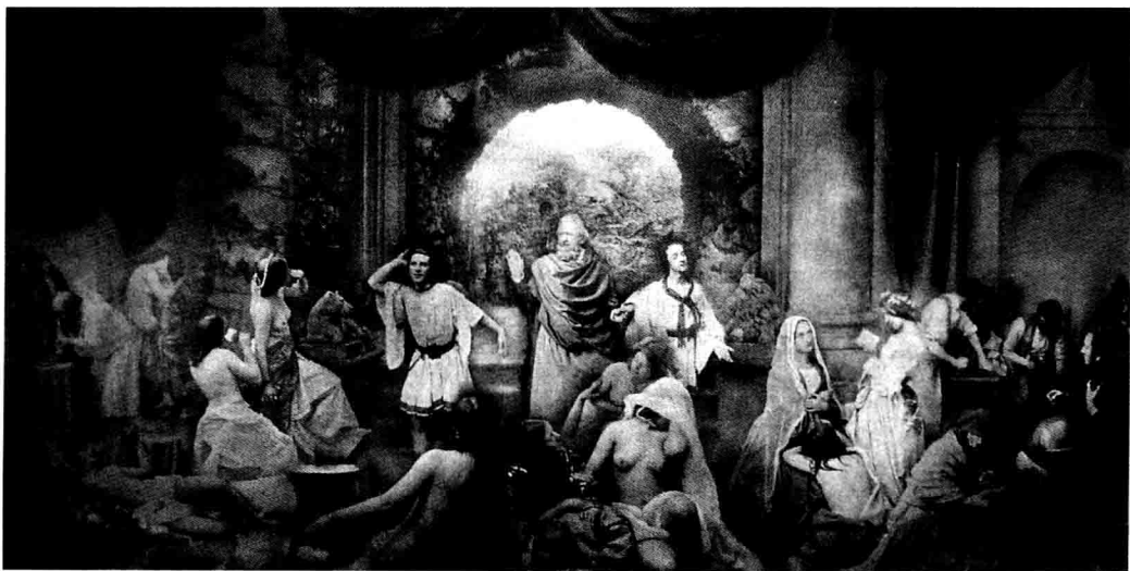
图1-6 两种人生 奥斯卡·雷兰德 摄

画意摄影运动以19世纪50年代主要从英国兴起的高艺术摄影为开端。当时，摄影是新事物，其纪实性和工艺性使社会对摄影是否是一种艺术争执不休。在竭力为摄影获取艺术地位的奋争中，产生了高艺术摄影。英国的奥斯卡·雷兰德以在“曼彻斯特艺术珍品博览会”展出他的作品《两种人生》（图1-6）而出名。这幅摄影作品模仿了拉斐尔的绘画风格。在拍摄时，他调用16个以上的模特，按预先设计好的位置摆好姿势，用了30