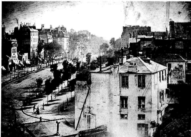
图1-3 巴黎寺院街 达盖尔 摄

达盖尔因银版法成为举世公认的摄影术发明人。银版法作为一种实用可行的摄影方法，虽成本和价格昂贵，但影像质量极为精细，自公布于世便迅速在欧美应用，直到19