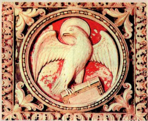
◆ 法兰克王朝时期的象牙雕刻

打败了西哥特王国之后，克洛维又开始算计自己的盟友河滨法兰克人。不过，克洛维也知道，一来自己的军队连年征战，需要时间休整；二来河滨法兰克人也是天生的战士，正面作战的话自己并不占优势。于是他打算在河滨法兰克人内部制造矛盾，然后坐收渔人之利。一次，克洛维派人邀请河滨法兰克人首领的儿子克洛德里克参加自己的宴会。酒过三巡，菜过五味，一脸笑容的克洛维在克洛德里克耳边说：“我的兄弟，现在你该是部落里权力最大的战士了吧？”克洛德里克摇头答道：“不，最有权力的还是我的父亲。”克洛维手握着酒杯，哈哈大笑，说：“我的兄弟，依我看，没有谁该比你的权力更大了，只是……”克洛维欲言又止，低头猛灌着烈酒。克洛德里克被挠到了痒处，低声请求克洛维替他想想办法，克洛维也乐得给他“指点迷津”：“如果你父亲去世，那河滨法兰克人不就全部听从你的命令了吗？”克洛德里克这下豁然开朗，头脑简单的他立刻明白了克洛维的暗示。在更大的权力和父子亲