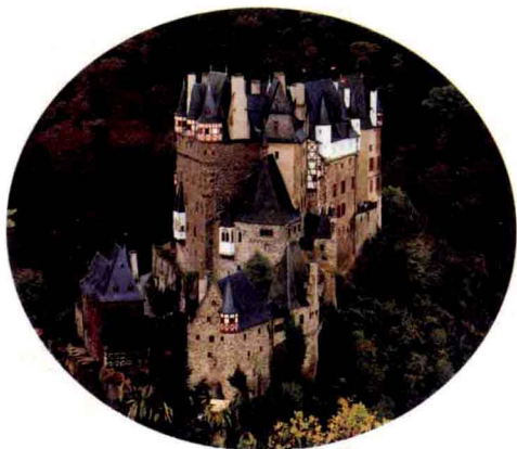
◆ 阿尔卑斯山中的城堡

不过，不是所有的日耳曼部落首领都被罗马人收买了，切鲁西部落的首领海尔曼就是一位坚强的战士。年仅27岁的海尔曼精通拉丁文，武艺高强，在他心中，没有什么事情比自由和独立更重要。不过，多次随罗马人出征的海尔曼深刻地认识到罗马军团的强大，他们精良的武器、严明的军纪绝不是轻而易举可以对抗的。于是，海尔曼静下心来等待时机。苍天不负苦心人，公元9年，罗马将军提贝留突然被调离了日耳曼尼亚。提贝留精明能干，对日耳曼人监控得滴水不漏，使得海尔曼始终不敢越雷池半步。提贝留的离去无疑是日耳曼人的福音。海尔曼开始联络志同道合的战友，准备推翻罗马人的统治。