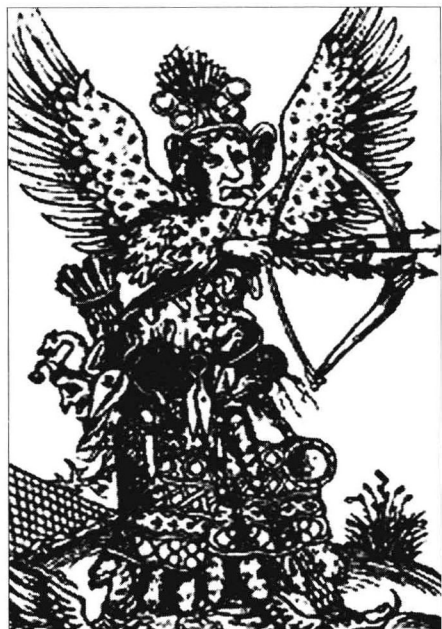
图 1-1 《谣言女神》(16 世纪)