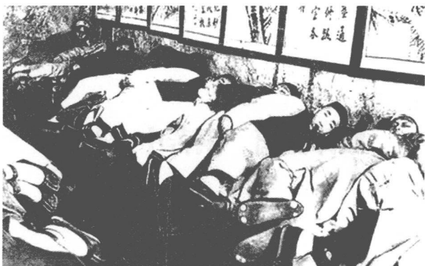
晚清时期的大烟馆

的坚船利炮还没有打开中国闭关自守的大门，但是晚清时期的中国已经风雨飘摇。中国社会在经历了“康乾盛世”之后，已经由盛转衰。