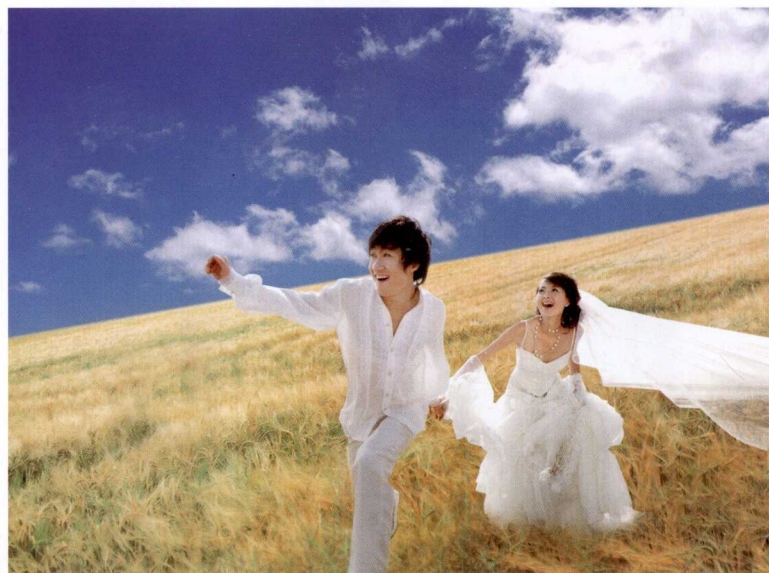
◎跑动抓拍的婚纱照具有浪漫的色彩。