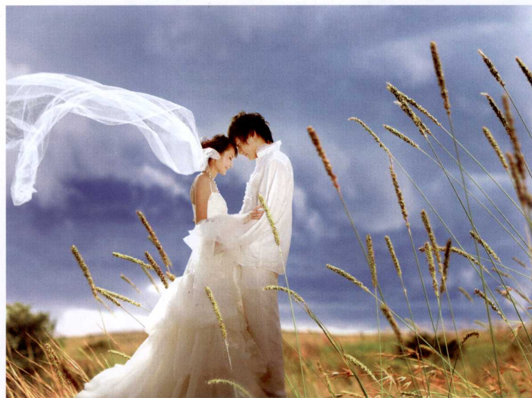
◎这是一幅后虚前实的时尚婚纱照，将主体表达和分层空白处理得非常完美。这也是利用相机镜头原理拍摄的成功范例。