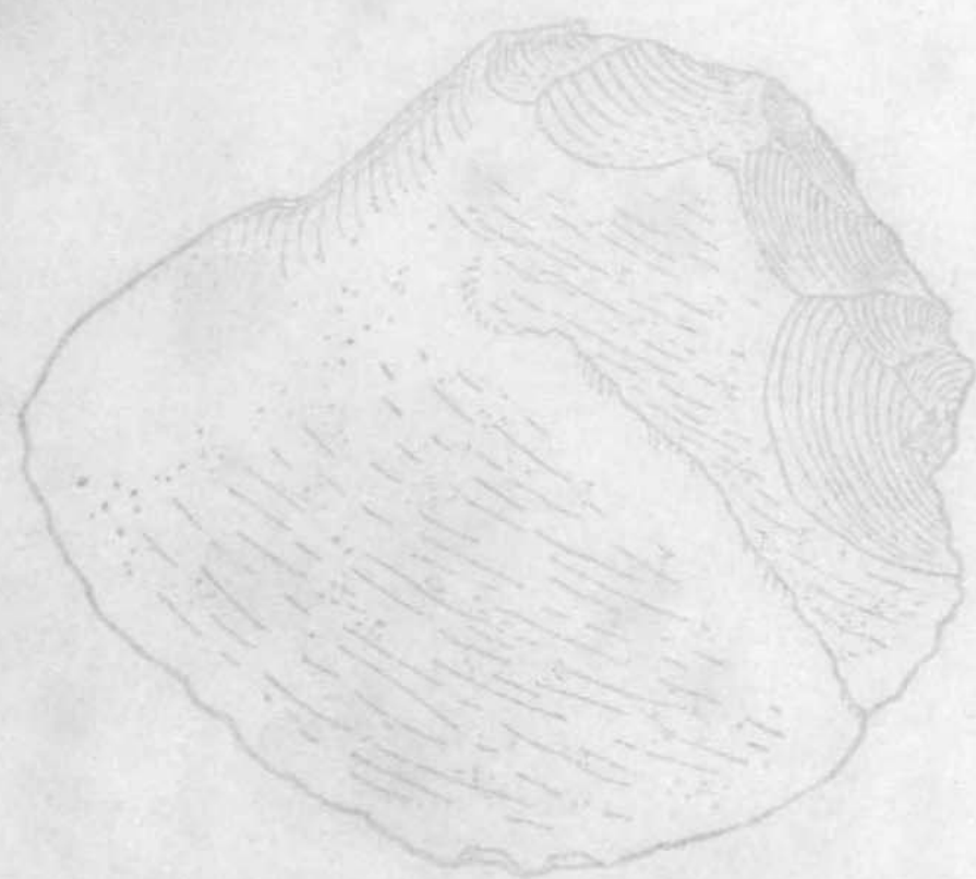
非京人其用工具——斧头