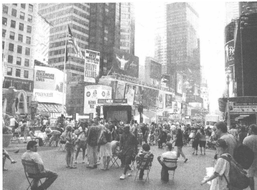
图 1-1 美国种族多元化(纽约街景)

7%左右,他们估计在第三代拉美裔和亚裔美国人中至少有50%与异族通婚。在不同种族通婚的比例中,黑白人通婚比例是最低的,但较之20世纪60年代前,还是有了很大进步,1970年人口普查中,只有6.5万对黑白通婚的家庭,1990年人口普查中,全国6%的黑人房主有异族配偶,1998年在跨种族婚姻中,白人/西班牙裔占52%,白人/亚裔占19%,白人/印第安人占12%,白人/黑人占9%,其他为7%,而最近的研究显示,约有十分之一的黑人娶了白人妻子,比黑人女子嫁给白人的比例略高一些。异族通婚比例的提高,从一个侧面说明了人们对族裔多元化的接受。但“多种族人”这个概念的使用,使人们重新思考关于种族、种族关系相关的问题,如在近2%的人选择自己是多种族,无疑会打破种族原有的格局,这是一些少数族裔组织和领导人不愿看到的,他们更强调种族的认同感。