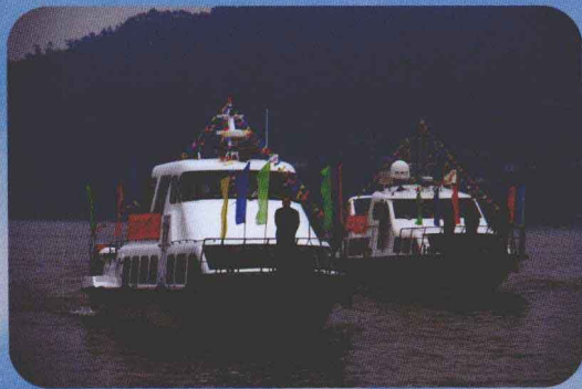
渔政船巡航宣传珠江禁渔制度