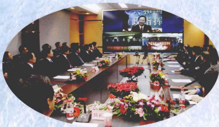
春节前夕，农业部部长韩长赋通过卫星可视电话亲切慰问了在钓鱼岛海域执行护渔维权任务的中国渔政201船执法人员。

2011年，东海区渔政局继续加强钓鱼岛海域常态化渔政巡航管理，切实维护了我国渔民生命财产安全，捍卫了国家主权和海洋权益。以东极新型海洋牧场示范区暨碳汇渔业实验区建设为重点，创新开展海洋生态修复工作。继续加强伏季休渔监管，深入开展“护渔2011”海洋渔业执法行动，维护渔业生产秩序。2011年是长江禁渔期制度实施第十年。长江禁渔十年来减缓了水生生物资源衰退趋势，开创了长江流域水生生物资源养护工作新局面。2011年，东海区渔业安全生产形势喜人，各项渔业安全指标均同比下降，实现了“十二五”渔业安全生产良好开局。继续以创先争优活动为抓手，大力弘扬和实践“东海精神”，切实加强思想建设、作风建设和队伍建设，并不断促进渔政业务建设再上新的台阶。