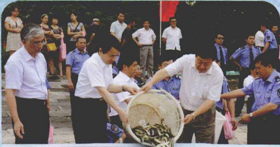
2011年农业部和江苏省联合举办了水生生物增殖放流活动