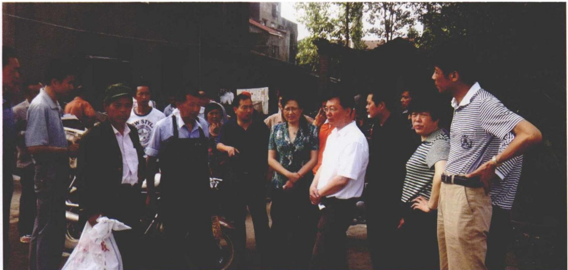
7月13日，农业部渔业局副局长、渔政指挥中心主任陈毅德和农业部抗旱减灾科技指导组一起，在湖北指导抗灾。2011年上半年，长江中下游地区遭遇严重旱灾，据统计，湖北、湖南、江西、江苏和安徽5省受灾养殖面积81万公顷，成鱼和鱼种损失74万多吨，经济损失近75亿元。