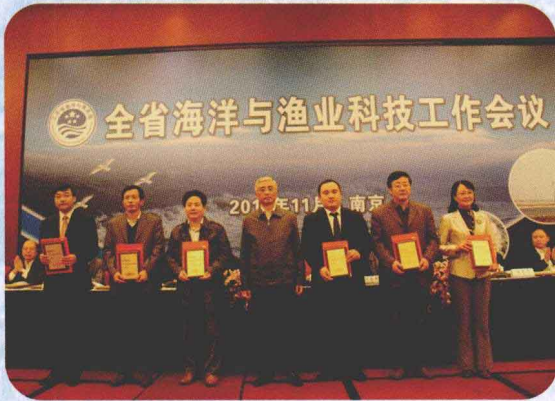
唐庆宁局长(中)和江苏海洋与渔业科技标兵合影

江苏省海洋与渔业局是江苏省政府主管全省海洋和渔业工作的正厅级直属机构。近年来,江苏渔业系统认真贯彻落实省委、省政府决策部署,大力推进现代渔业建设,渔业整体发展水平走在全国前列。2011年,全省水产品产量475万吨,实现渔业经济总产值1500亿元,其中渔业一产(养捕业)产值超千亿元。渔民人均纯收入超过1.3万元。