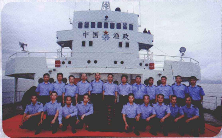
中国渔政南海总队守礁18年来锻造的“南沙精神” 被评为农业部“三种精神”之一