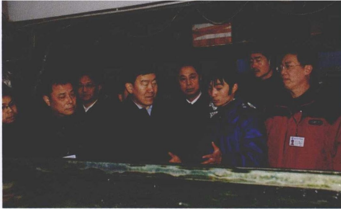
1月26日，农业部副部长牛盾，农业部渔业局局长赵兴武一行，考察上海水产品市场。