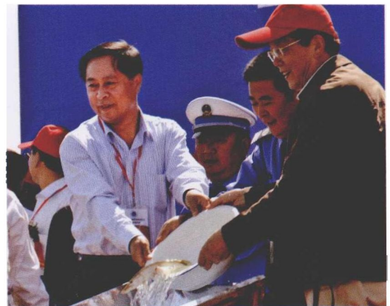
8月30日，农业部、新疆维吾尔自治区人民政府和新疆生产建设兵团共同在乌伦古湖举行水生生物资源增殖放流活动。农业部副部长牛盾和农业部渔业局局长赵兴武参加放流活动。