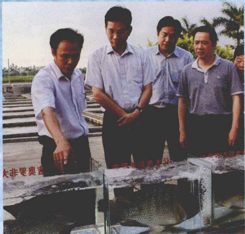
广东省副省长刘昆到茂名调研现代渔业