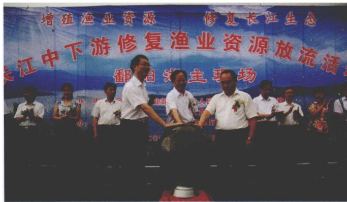
7月12日，农业部与江西、湖北、湖南、安徽、江苏等省人民政府联合启动长江中下游渔业资源修复活动。农业部副部长危朝安、牛盾，农业部渔业局局长赵兴武等，分别出席各地放流活动。此次活动共设置101个放流点，放流各种经济鱼类13亿尾，种植水草9000公顷，底播贝类2100万粒。