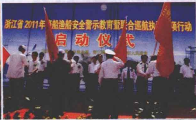
宋志俊副局长在渔船安全警示教育暨综合执法行动启动仪式上为执法人员授旗。