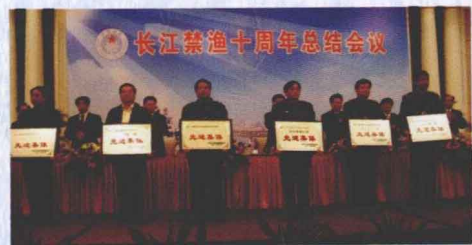
11月，长江禁渔十周年总结表彰会议在武汉隆重召开。会议总结了长江禁渔十年工作，对先进集体和先进个人进行了表彰。