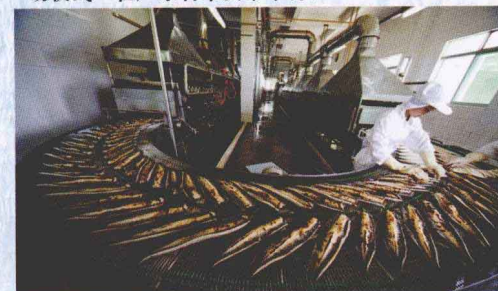
广东现代化的鳗鱼加工生产线