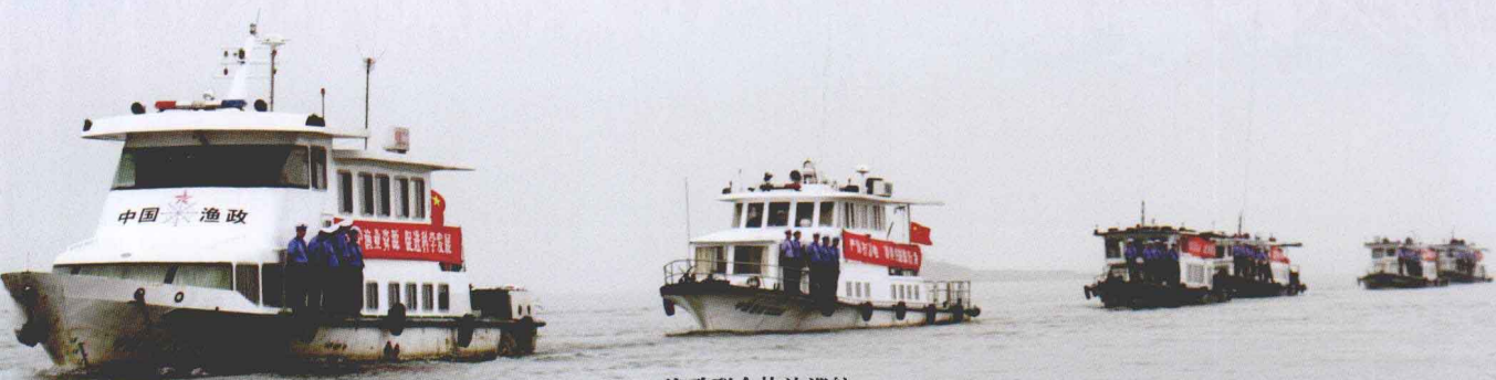
渔政联合执法巡航

注重渔业民生改善 实施了池塘标准化改造,渔港码头和执法基地建设取得新进展。渔业政策性保险起步,2011年收取保费6590万元,保额达138亿元,参保渔民13.6万人,参保渔船8124艘。渔民社会保障覆盖面加大,渔民维权的渠道通畅,渔区和谐安定。