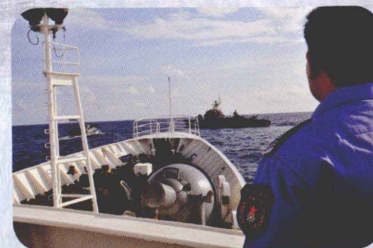
解救遭外国武装船只抓扣的我国渔船

在农业部和广东省委的领导下，农业部南海区渔政局深入学习党的十七大及五中、六中全会和胡锦涛总书记“七一讲话”精神，深入贯彻落实科学发展观，积极开展“创先争优”活动，按照全国渔业工作会议的工作部署，在农业部渔业局、渔政指挥中心的指导下，紧密结合南海与珠江流域渔业管理实际，稳步加强渔业综合管理，促进渔业科学发展，主动作为，扎实推进各项工作，在南沙守礁与维权护渔、西沙监管、北部湾协定实施和珠江流域禁渔等方面取得了新成效。