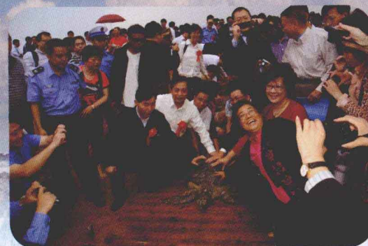
坚持开展野生动物保护与资源增殖放流活动