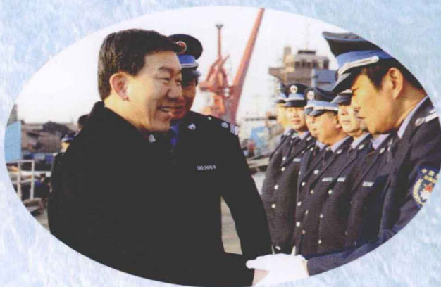
农业部副部长牛盾（左一）亲临中国渔政东海总队慰问渔政船员。