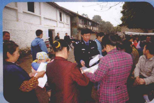
向渔民宣传珠江禁渔制度