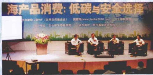
5月，东海区渔政局在上海科技馆举办了低碳环保沙龙：碳汇渔业专题活动。碳汇渔业理念发起和倡导者唐启升院士（左二）和农业部东海区渔政局李富荣局长（右二）以嘉宾身份出席。