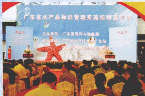
广东省率先在全国开展水产品标识管理