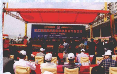
4月1日，由农业部渔业局和中国渔政指挥中心主办的“2011年珠江禁渔期启动暨同步执法行动启动仪式”在广东省肇庆市举行。