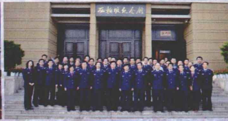
东海区渔政局在石家庄举办第十三次思想政治工作暨中心组学习会议。