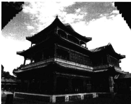
图 1.2-5 北京颐和园内德和园大戏楼

清代宫苑中的戏楼是综合了民间戏台建筑的精华发展而成的一种观演建筑,不仅面积大,而且变单层为二至三层。这些戏楼大多坐南朝北,和观戏的殿堂组成四合院。现存的清代宫廷戏楼有建于清乾隆时期的宁寿宫畅音阁,以及建于清光绪时期的颐和园内德和园大戏楼(图 1.2-5)。