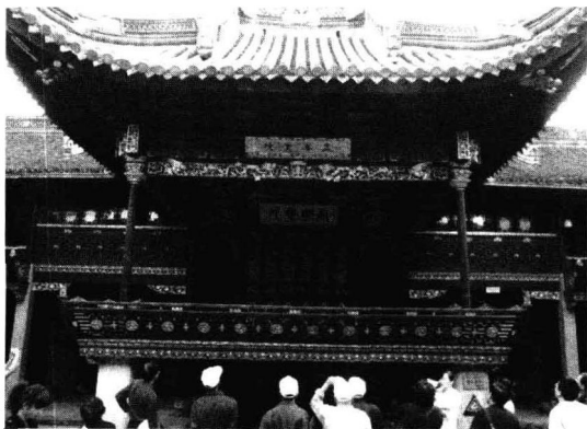
图 1.2-4 浙江宁波天一阁

在古代中国,历代官府均修建藏书楼。自宋以来,我国各府、州、县学内多建有藏书楼,宋代称“稽古阁”,明清称“尊经阁”。宋以后,喜爱典籍又有条件的私人也可以修建藏书楼。