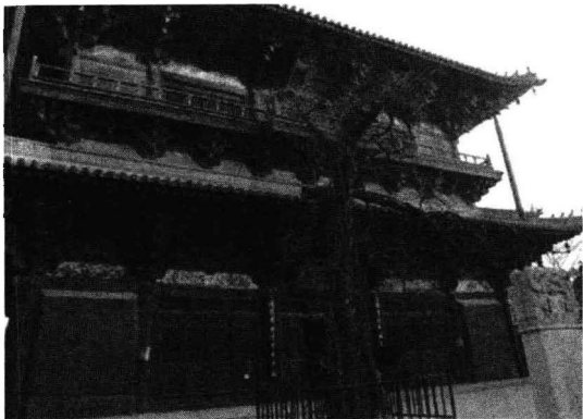
图 1.2-3 天津蓟县独乐寺观音阁