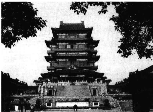
图 1.2-2 南昌滕王阁

中国历史上著名的楼阁几乎都是景观性楼阁,如“江南三大名楼”中湖北武汉市的黄鹤楼、湖南岳阳市的岳阳楼(原为岳阳城之西门城楼,后失去防御作用而成为景观性楼阁)、江西南昌市的滕王阁(图1.2-2)。自古以来,中国的文人墨客都爱登楼泼墨,临阁赋诗,追古思今,寄怀遣愁,从而在这些景观性楼阁上留下了诸多雅文韵事。