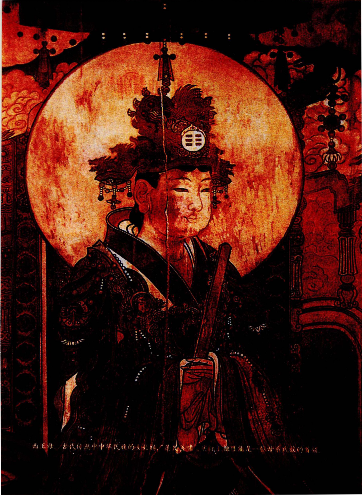
西王母。古代传说中中华民族的女始祖，“耳戴胜簪”，实际上她可能是一位母系氏族的首领。