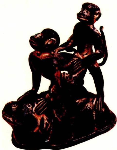
铜塑：猿猴交配(清代)

人类是由动物进化而来的，这种进化表现在许多方面，也表现在性问题上。对人来说，饿了就想吃东西，到了青春发育期以后就有性欲要求，这都是人和动物所共同具有的自然本性。但是，人是高级动物，是社会化的动物，人类的性要求决不能简单地归结为自然本性，它受自然本性所支配，但更受社会因素的支配，为当时的社会经济发展水平所制约。人类的性行为实质上是一种文化现象。它受到感情、道德、风俗、法律、智识的影响和制约，千千万万年以来，以上这些条件发展着、变化着，从原始的、谬误的变成比较合理的、进步