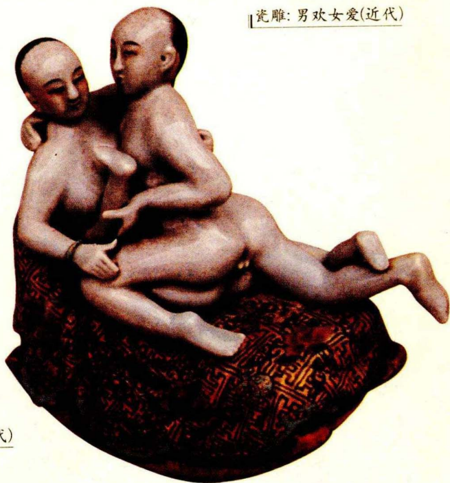
瓷雕：男欢女爱(近代)