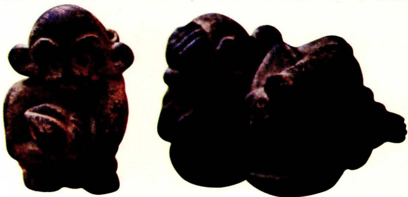
陶塑：猴子对食与性满足的快乐(明代)