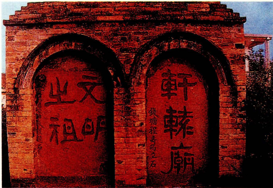
轩辕庙。黄帝是传说中中华民族的祖先，也是一位房中术专家。古代有“黄帝御千二百女而成仙”之说。

有人也许会说，人类社会、历史的发展有它的必然性，性和女人只不过是历史发展过程中的偶然因素罢了。这当然是对的，可是，对这“偶然因素”的力量也决不可低估。例如汉朝末年的董卓，逼宫专权，作恶多端，许多人恨之入骨，但是因为董卓有万夫不当之勇的吕布保卫，人们无可奈何。后来，王允施用美人计，貂蝉充当了色情间谍，挑拨吕布和董卓的关系，最后把董卓剪除了。也