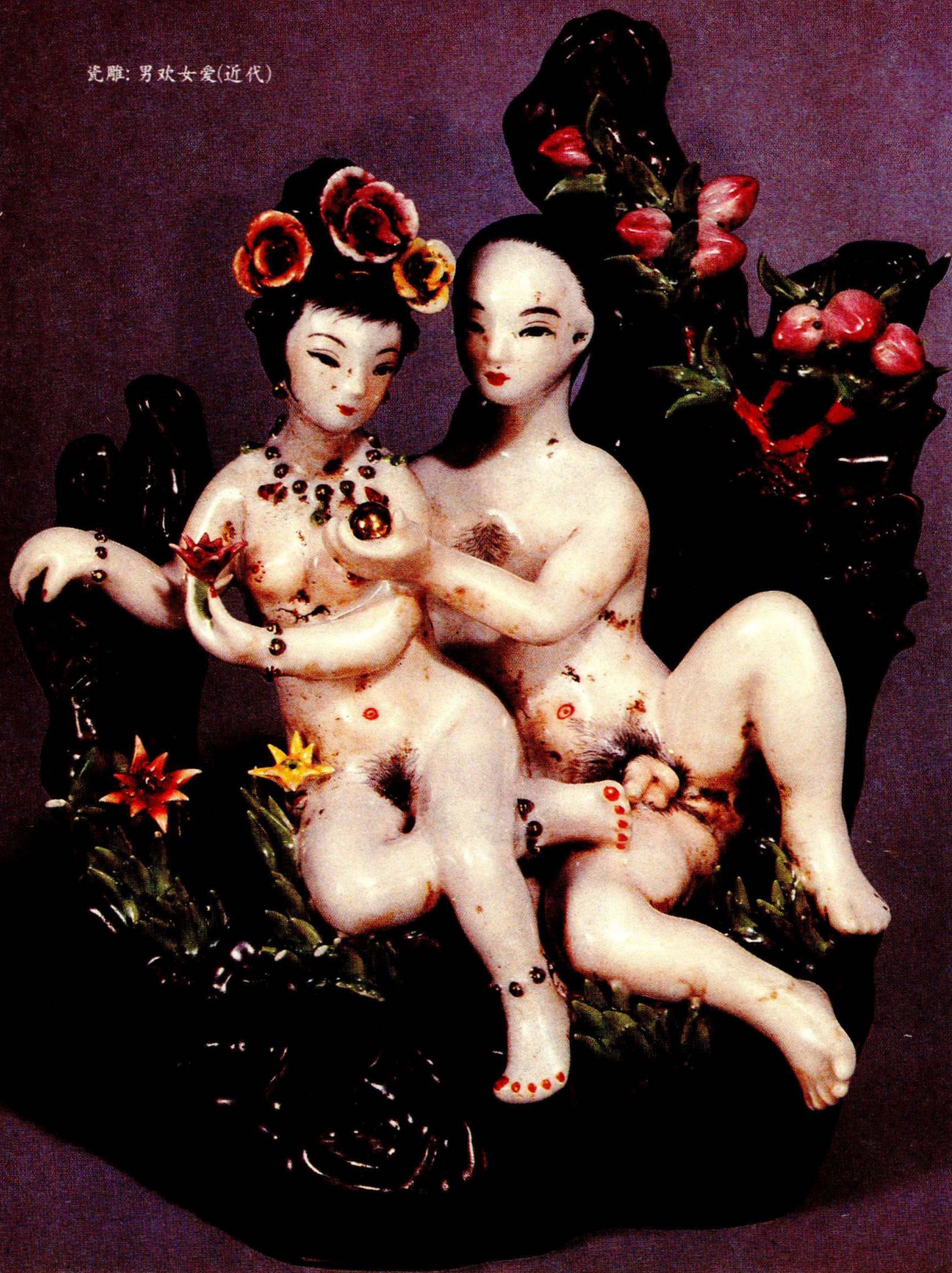
瓷雕：男欢女爱(近代)