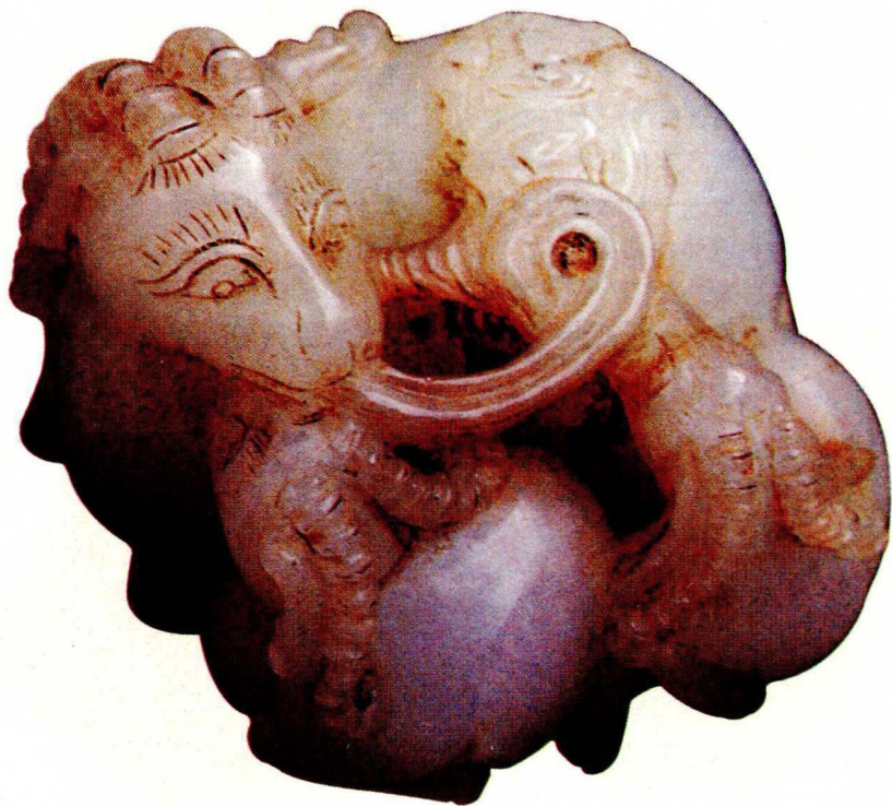
玉雕：羊的繁殖(近代)