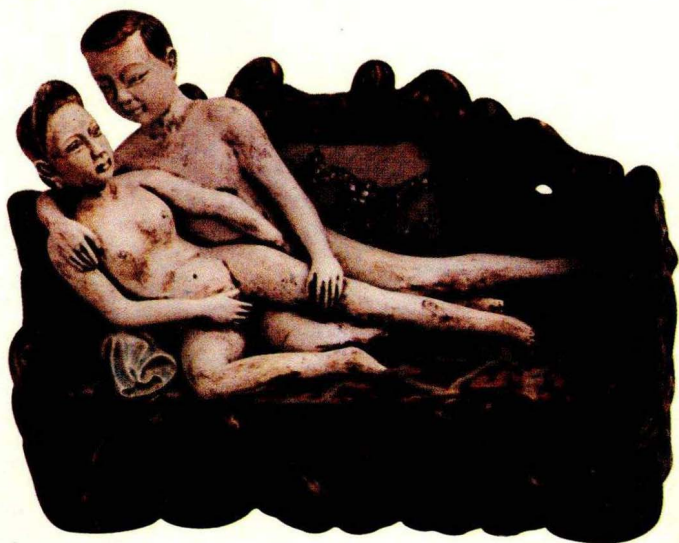
瓷雕：男欢女爱(近代)