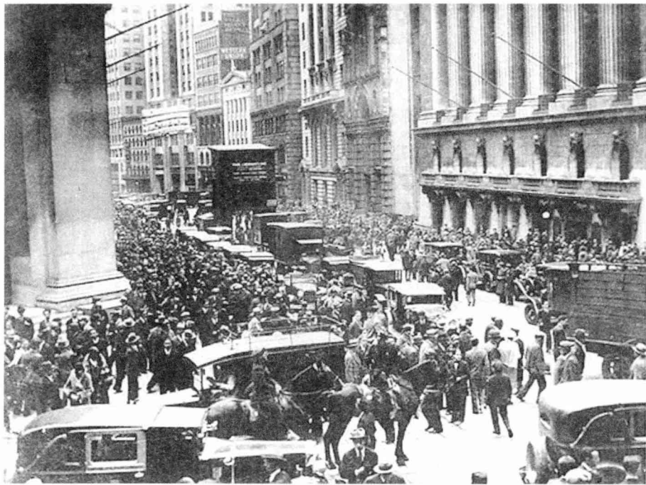
1929年开始的资本主义经济大危机