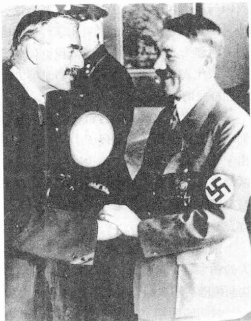
英国首相张伯伦于1938年在慕尼黑会议上和希特勒会面