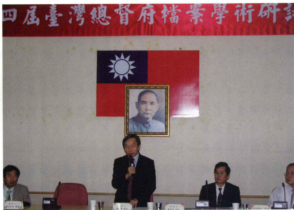
研討會開幕典禮邀請國史館張館長炎憲蒞臨致詞