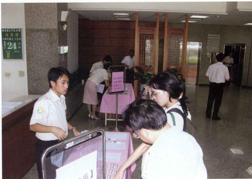
研討會參加人員報到情形（一）