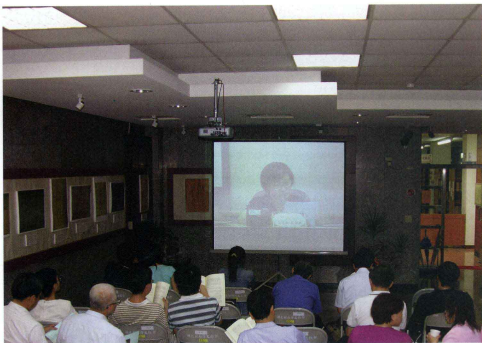
研討會場外實況轉播