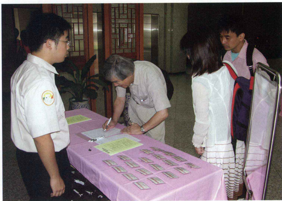
研討會參加人員報到情形（二）