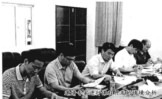
邀请专家进行课程开发的情境分析

校本课程是以学校为主体自主开发的课程,它以所在地方、具体学校和具体学生的独特性与差异性为其出发点和落脚点的,所以个性化是它的一大特点。从理论上讲,校本课程绝不是“千校一门”,而是“千校千门”,每所学校的校本课程应是独一无二的,其校本课程体系也是丰富多彩、各具特色的。将个性化体现在校本课程的开发之中,我们就必须从所在地区、学校实际出发,对学校情况进行必要的全面的分析,包括挖掘学校自身、地方文化教育资源,分析学校办学传统和优势,了解教师特点和专长,调查学生学习背景和学习需求,总结提炼学校教育思想和办学理念,等等。这些都统称为情境分析。这是校本课程开发的第一步。