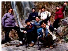
在天子山龙泉瀑布