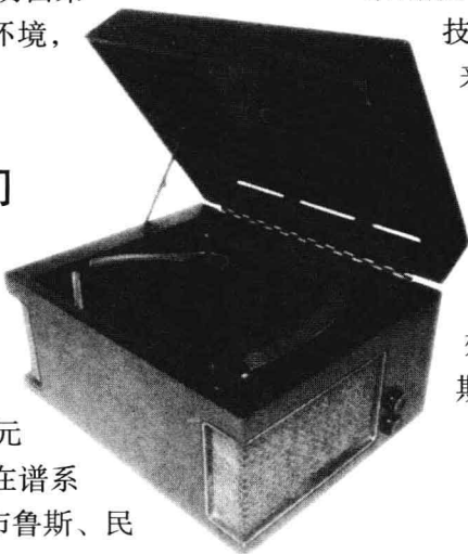
◀◀ 78 R.P.M. (每分钟78转)的唱片标志着音乐从记谱到录音的转变。

19世纪末20世纪初，海量销售的散页乐谱使音乐出版业蓬勃发展。当时由于录音、灌制技术的局限，不管费多大劲儿，做出来的唱片都吱啦作响，相比之下，印“歌篇儿”则容易多了。开天辟地头一回，一首歌曲能被大量印刷，仅在一个城市就卖掉几千份，这不仅完全颠覆了民谣口头传播的传统，更创造了前所未有的经济效益。散页乐谱的销量在20世纪初呈一发不可收之势，1890—1909