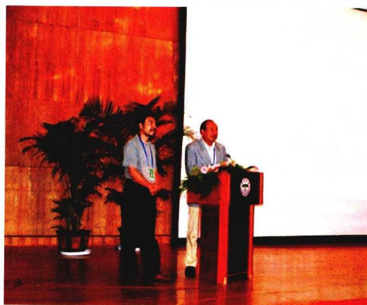
第16届人类学世界大会电影节开幕式