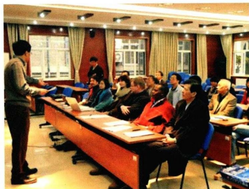
第16届人类学世界大会电影评选