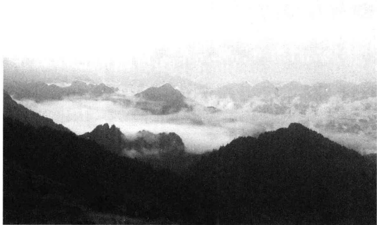
曾经是一片古海的神农架

神农架位于湖北省西部边陲,东与湖北省保康县接壤,西与重庆市巫山县毗邻,南依兴山、巴东,紧靠三峡,北倚房县、竹山,邻近武当,地跨东经 109^{\circ}56' — 110^{\circ}58' ,北纬 31^{\circ}15' — 31^{\circ}75' ,总面积3253平方公里,为长江、汉江分水岭上特色独具的一片生态宝地。