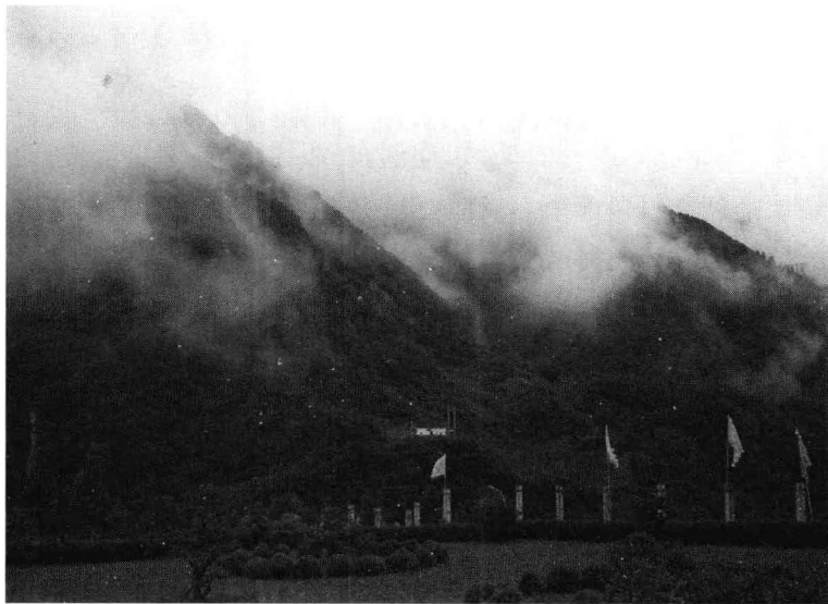
莽莽林海,云缭雾绕

神农架的存在对于森林生态学的研究具有标本性的意义,3253平方公里的灵秀山川因其特殊的地理位置,躲过了第四纪冰川的劫难,成为一座巨大的生物避难所。神农架原始森林里,生长着无数远古遗存下来的珍贵、稀有、濒危植物,深藏着举世称奇的飞禽走兽,海燕在神农架林区海拔2300米的地方生息不迁,静谧繁衍;众多白化动物的发现和“野人”的时隐时现……一个天然的动植物标本馆和活标本库,汇聚有我国西双版纳至漠河、日本中部至喜马拉雅一线的大部分动植物物种,有“物种基因库”、“天然动物园”、“绿色宝库”的美誉。