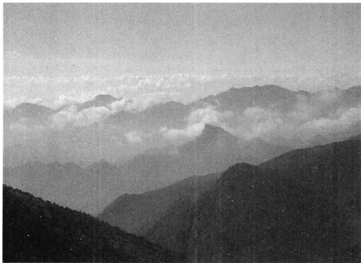
巍峨苍茫的华中屋脊——神农顶

横亘于神农架林区中部的神农架山脉,是大巴山脉东延的余脉,向东与荆山山脉相连,地势西南高,东北低,山脊海拔一般在 1500 米以上,海拔 3000 米以上的山峰有 6 座,以海拔 3106.2 米的神农顶为最高,是华中地区的最高点,被誉为“华中第一峰”。林区内 99.2% 的地区海拔在 800 米以上,神农架又被誉称“华中屋脊”。