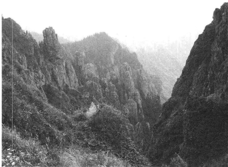
神农架风景埡

古老神奇、原始苍莽的神农架，东连荆襄，西通巴蜀，南接夷陵，北临武当。因神农氏筑坛搭架尝百草而得名。在这里，秦岭、大巴山东端的茫茫群峰竞相耸立，千峰攒簇，云遮雾障。神农架林区是世界同纬度地区唯一的一块绿色领地，茂密的森林对长江中下游地区起着气温调节、雨量扼控的重要作用。