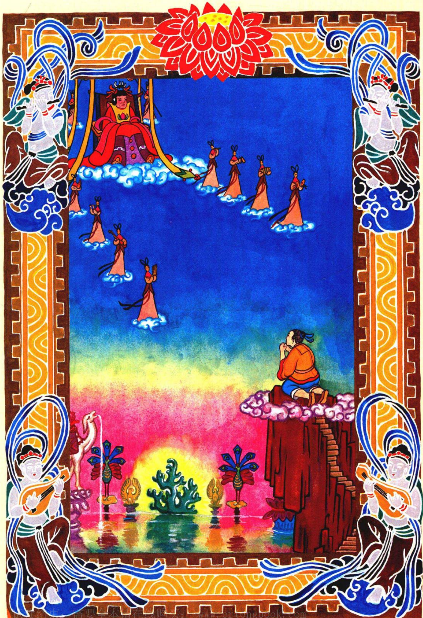
王母娘娘是位美丽的妇人，旁边环绕着仙女，演奏出悠扬的仙乐。来宝走上前去拜见王母娘娘。