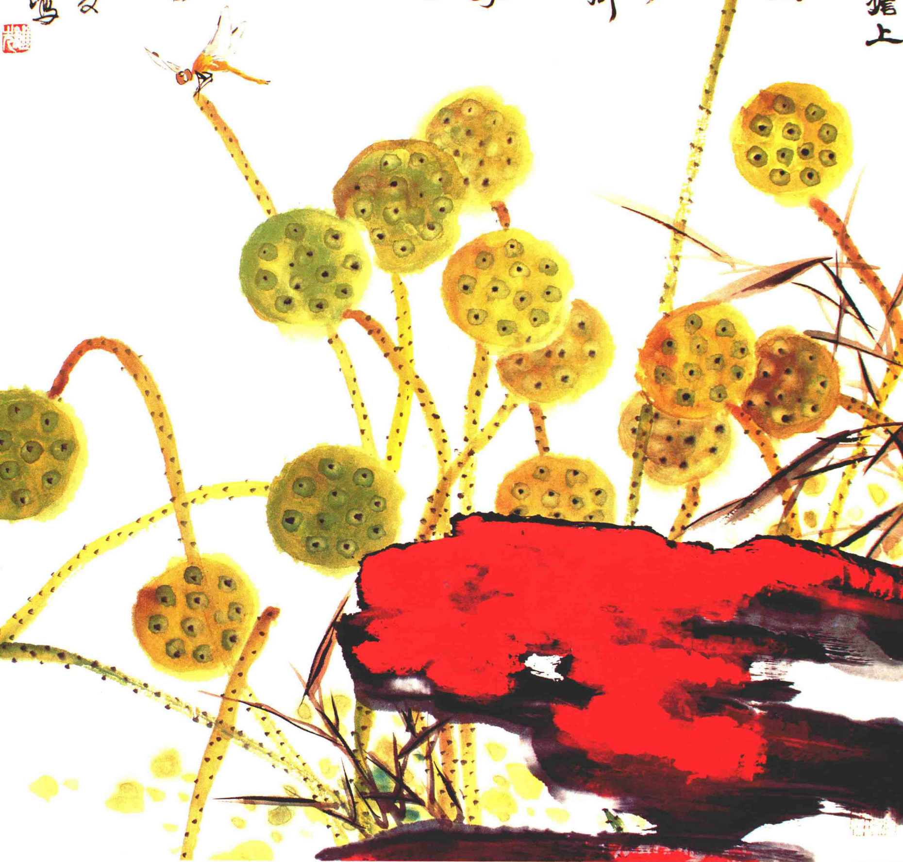
作者：沪上著名画家 龚继先