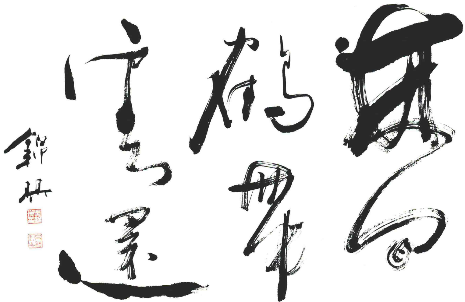
林间鹤带云还 120cm × 68cm