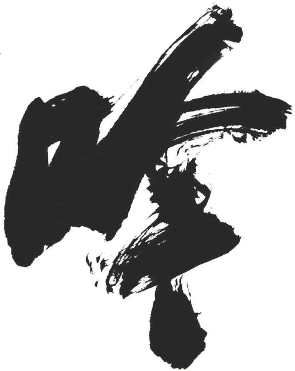
龙吟 56cm × 119cm