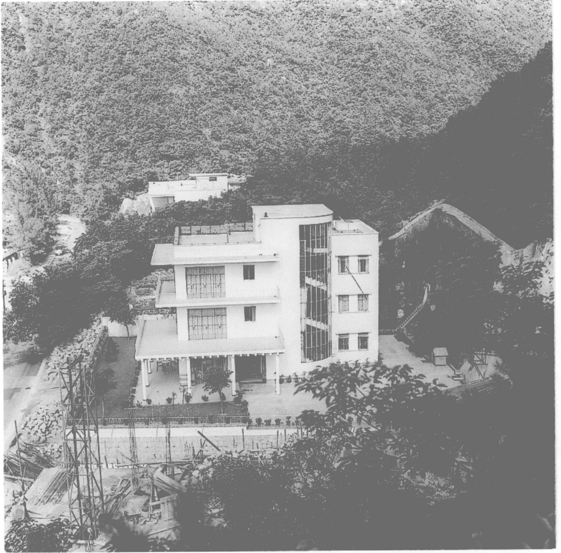
香港大坑道幼稚園 一九五六年至一九六三年 潘新安先生捐贈