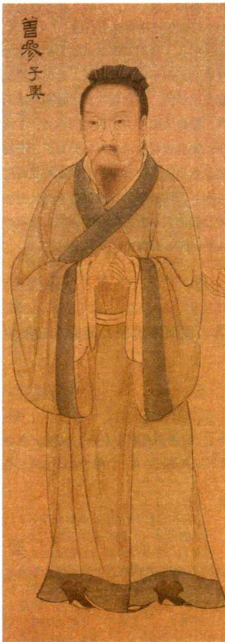
孔子弟子像卷之曾参像·宋·无款

然而人很容易在纷繁复杂的人生旅途中失去自我：当我们稍有点成就时，或许会飘飘然不知自己为何许人也；遇到挫折和失败的时候，又会妄自菲薄，自怨自艾。等到夜深人静，一切繁华和喧嚣都悄悄隐去，我们独自面对自己心灵的时候才能正确地审视自己。“静坐常思己过”，今天哪些事做对了？对在哪里？哪些事做错了？错在何处？人生的成功和失败往往在于那些被我们所忽视的细小的环节上，而只有当大脑处于相对冷静的状态下时，才能明察秋毫。人们需要反省是基于以下两个因素：一是主观原因，每个人都不是十全十美的，人总是在个性和智慧方面存在着种种不足和缺陷。二是客观原因，我们都生活在现实中，别人的言论和判断都可能对你产生影响，导致你的行为可能出现错误。想脱颖而出成为优秀的人物，就必须时刻反省自己。