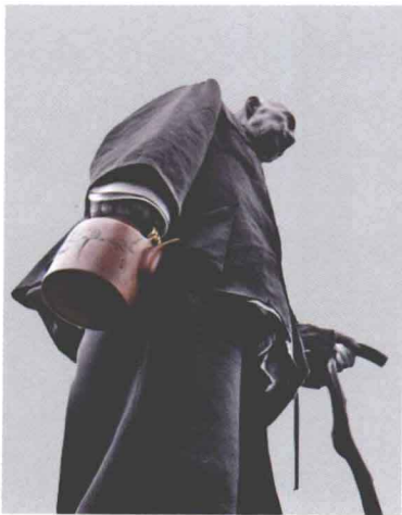
茶中化因缘，壶里有乾坤

紫砂器具，由陶器发展而成，属陶器茶具的一种。它坯质致密坚硬，取天然泥色，大多为紫砂，亦有红砂、白砂。这种陶土含铁量大，有良好的可塑性。紫砂器具的色泽，可利用紫砂泥和质地的差别，经过澄、洗，使之出现不同的色彩，如可使天青泥呈暗肝色，蜜泥呈淡赭石色、石黄泥呈朱砂色，梨皮泥呈冻梨色等；另外，还可通过不同质地紫泥的调配，使之呈现古铜、淡墨等色。优质的原料，天然的色泽，为烧制优良紫