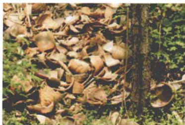
蜀山古龙窑遗址及堆积物