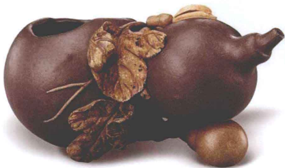
葫芦形水丞 陈鸣远制

陈鸣远制作的茶壶，线条清晰，轮廓明显，壶盖有行书“鸣远”印章，至今被视为珍藏。据《阳羨名陶录》记载“鸣远一技之能世间特出”。著名现代宜兴紫砂陶艺家顾景舟先生评价说：“我从事砂艺六十年，明末清初最杰出的砂艺家首推陈鸣远。”可见其影响力之大。陈鸣远的作品铭刻书法，讲究古雅、流利，其传世之作也仅有难得的几件。另外，此时期的名家还有房荣、王南林、邵元祥、邵旭茂、陈观候等。