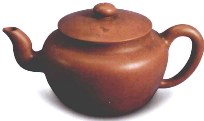
古莲子壶 邵旭茂制