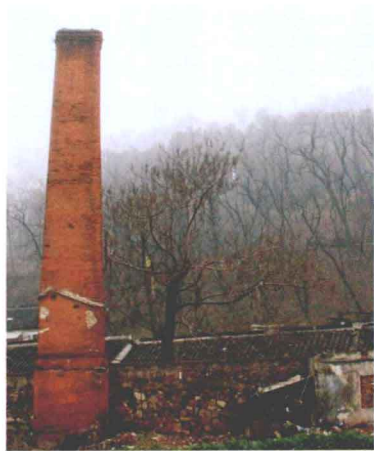
宜兴蜀山古窑的烟囱

长期实践的自我价值肯定。人们创造出这个传说，把这种智慧灵光和电光石火般的神奇发现，赋予一位云游至此的怪和尚，是因为紫砂艺人们面对这种神妙的物质发现，找不到由渐进演变为突变的因果关系，只有赋予奇特的演绎才会有合情合理的诠释。